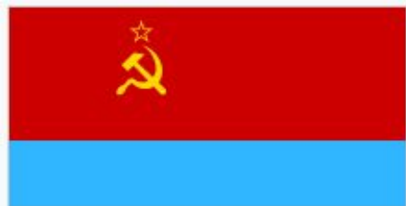
Флаг Украинской ССР