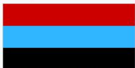
Флаг Интердвижения Донбасса