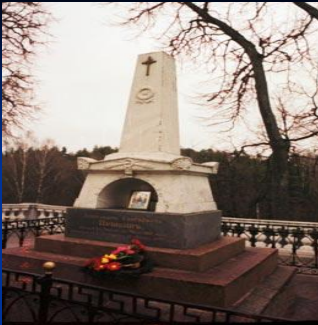
Могила А.С. Пушкина.