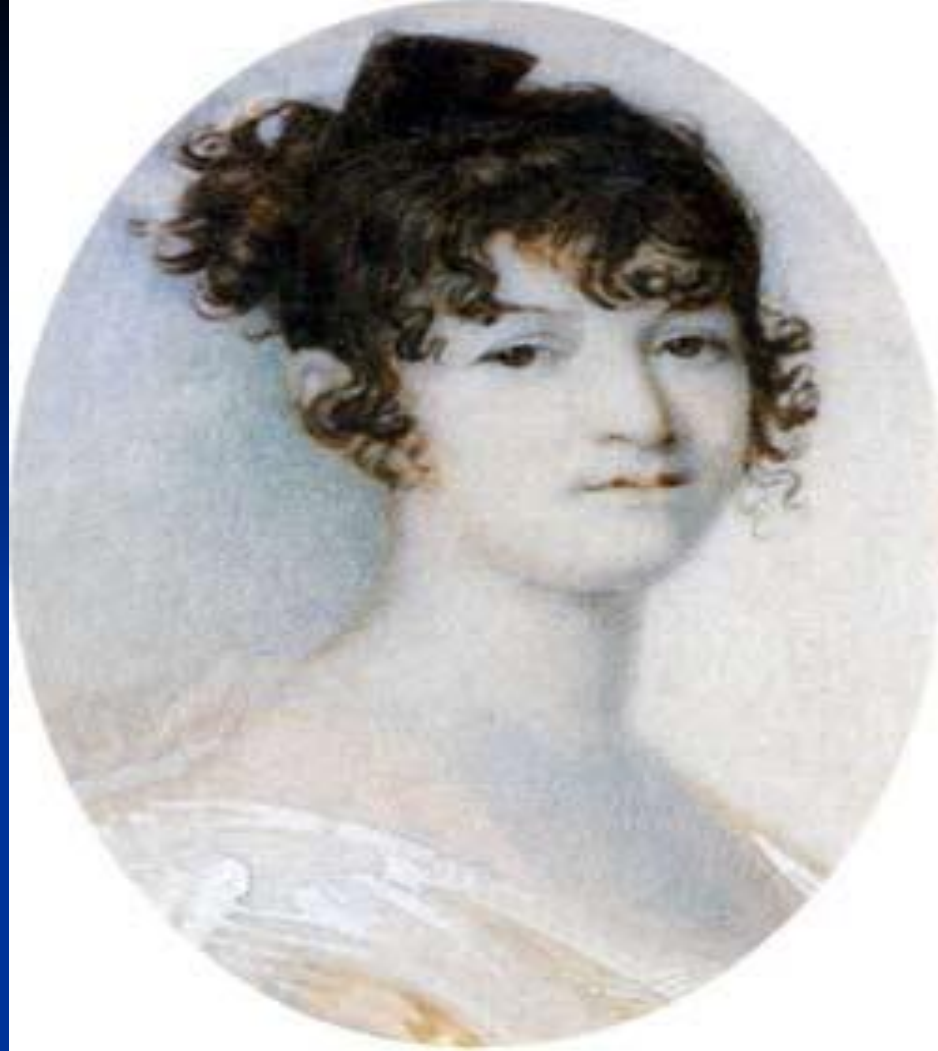
Надежда Осиповна Пушкина, рожд. Ганнибал (1775-1836), мать поэта.