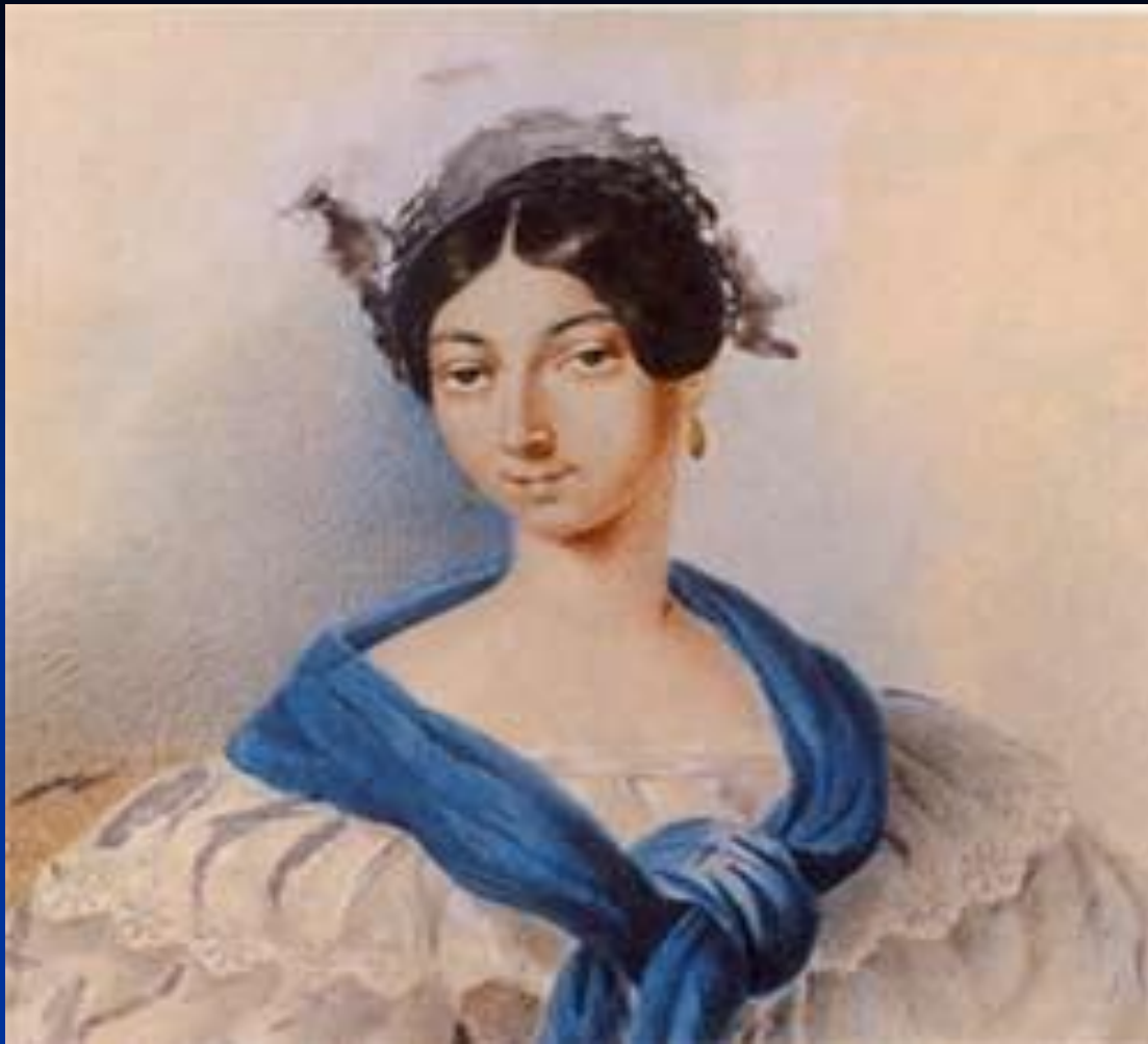
Павлищева Ольга Сергеевна, рожд. Пушкина (1797-1868) — сестра поэта.