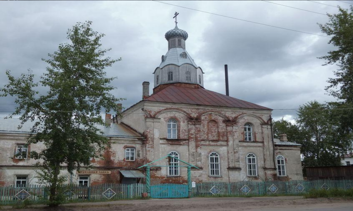
Троицкий Шенкурский женский монастырь. Церковь Зосимы и Савватия Соловецких