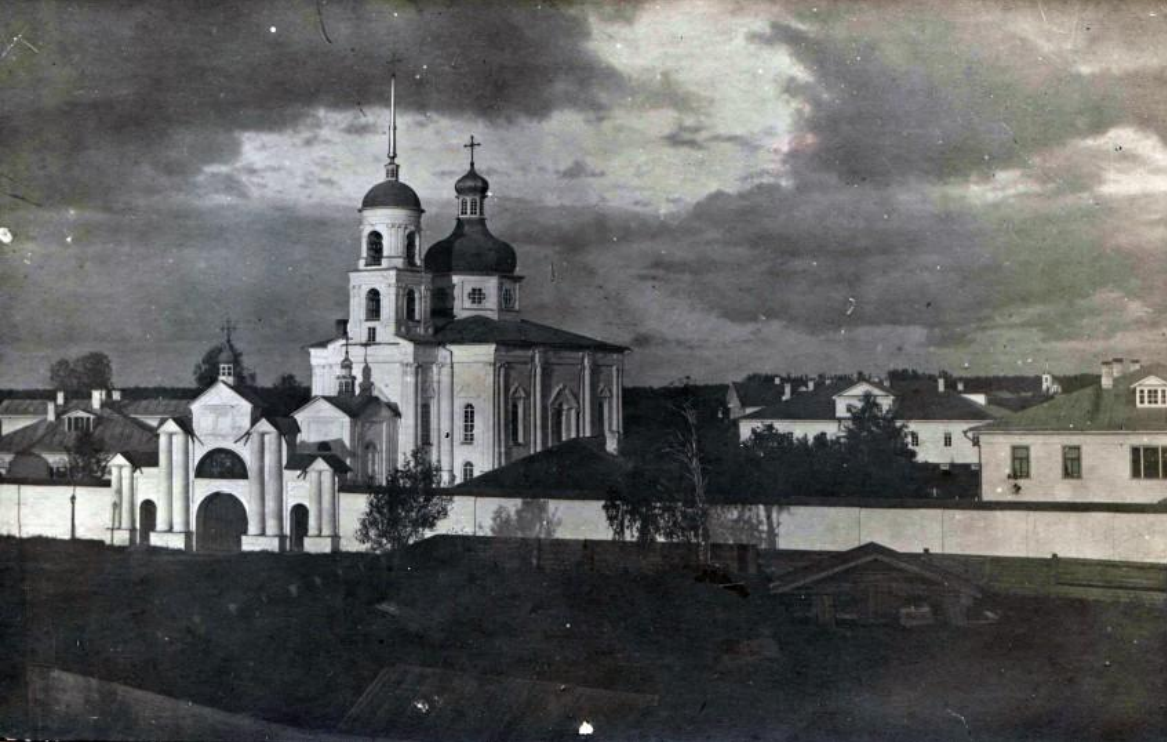
Троицкий Шенкурский женский монастырь;