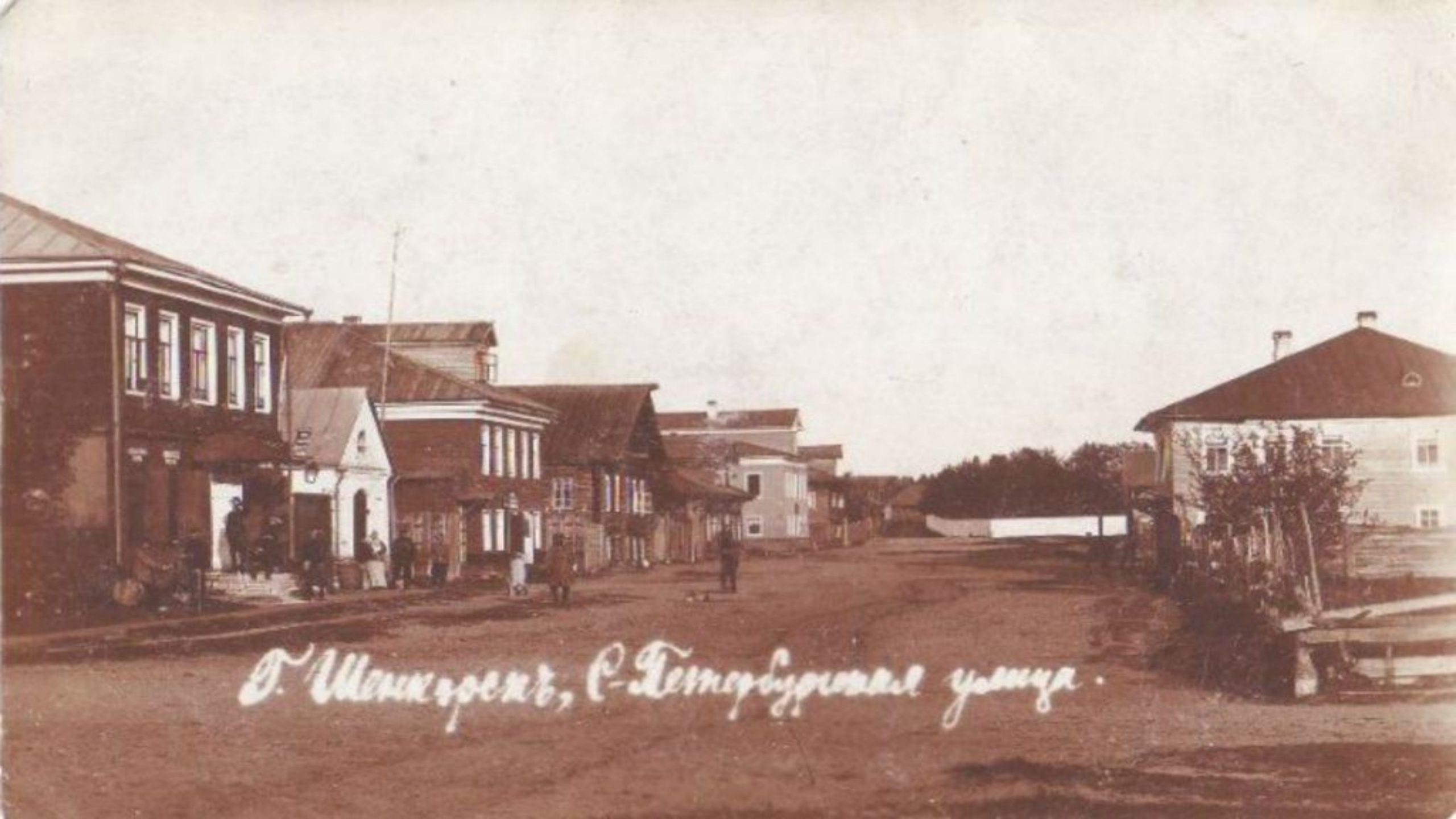
D. Манропъ, С. Темнубузовская яма.