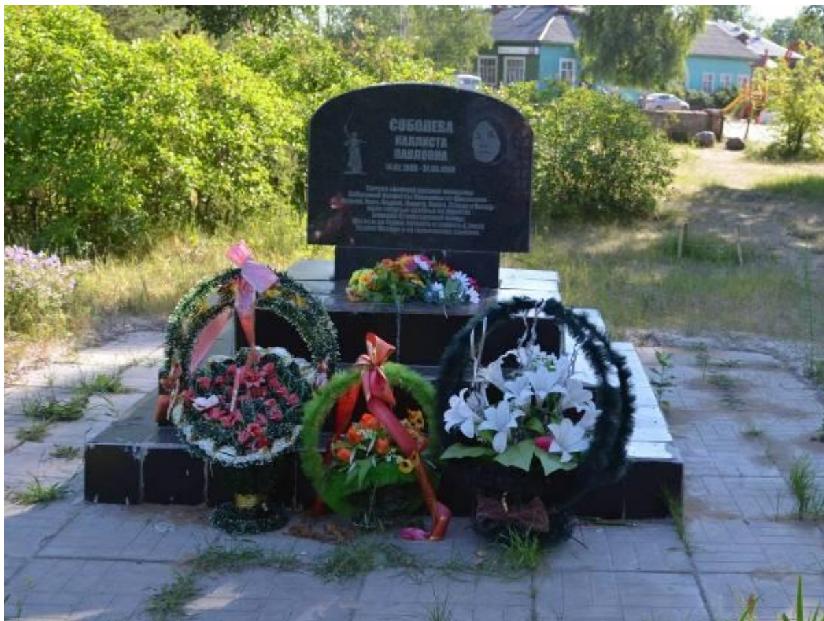
Памятник солдатской матери Калисте Павловне Соболевой