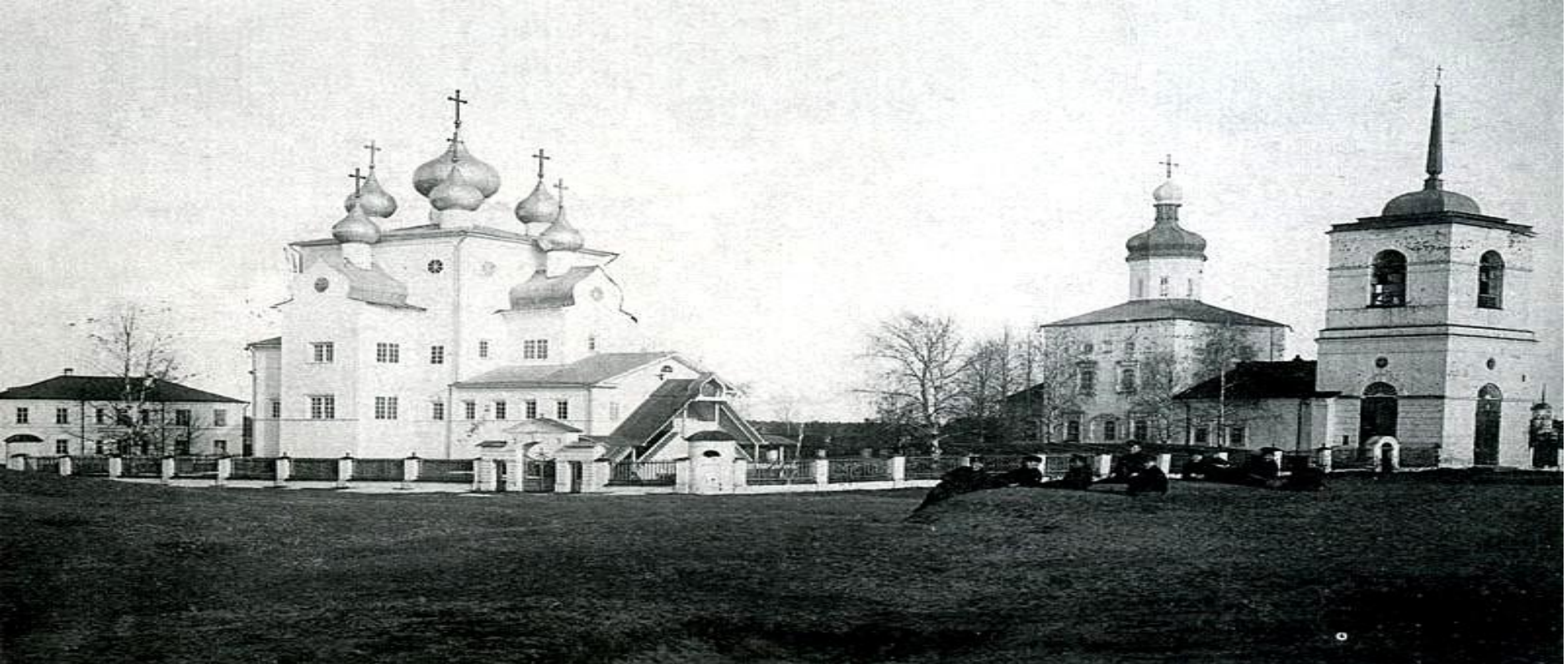
Шенкурск. Собор Михаила Архангела