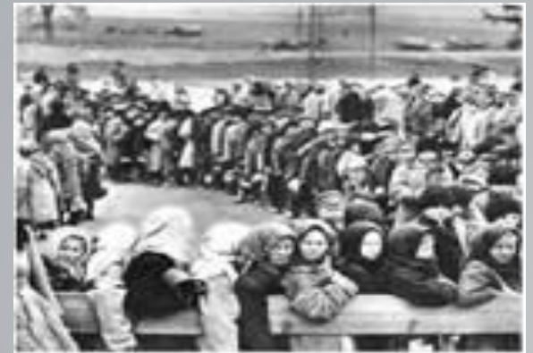
Діти-біженці в черзі за хлібом. Росія. Фото. 1917 р.

Яким постає життя біженців на поданих фотографіях?