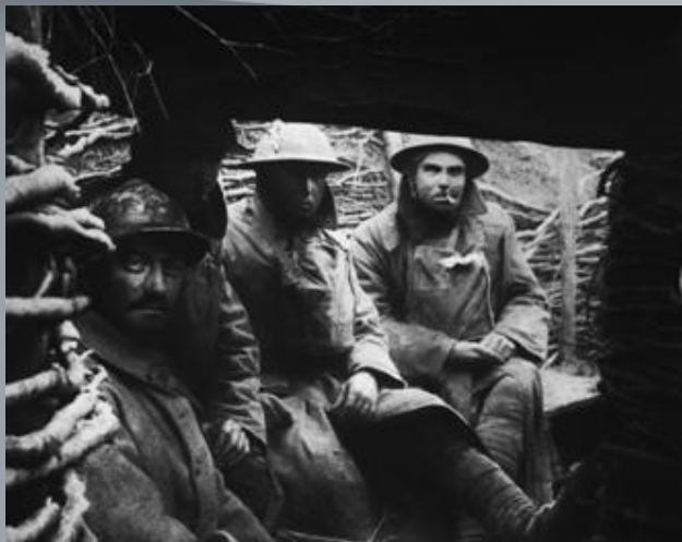
Французькі та англійські солдати в окопах