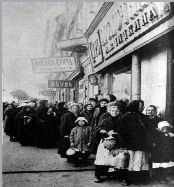
Черги за хлібом у Петрограді