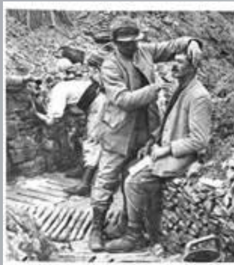
Імпровізована перукарня у французькій траншеї. Фото. 1916