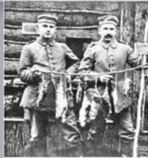
Німецькі солдати після нічного полювання на пацюків. Фото. 1916 р.