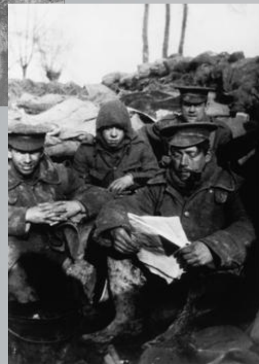
Англійські солдати відпочивають у перервах між боями