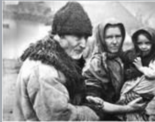
Польські біженці. Фото. 1916 р.