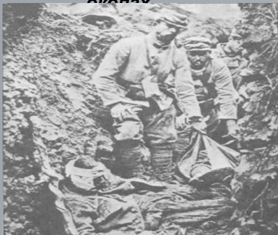
Жахи окопного життя