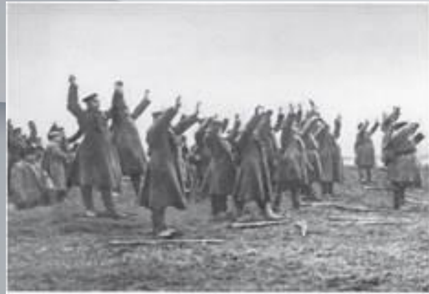
Росіяни здаються в полон. Фото. 1915 р.

Проаналізуйте діаграму. Чому, на Вашу думку, кількість військовополонених у різних країнах суттєво відрізнялася?