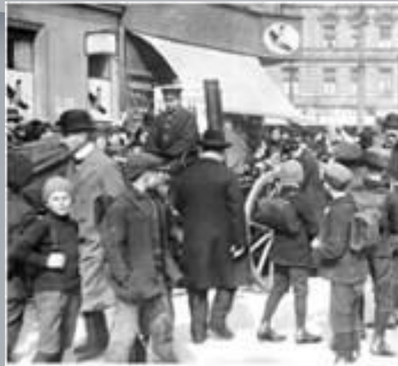
Роздавання безкоштовного супу. Німеччина. Фото. 1916 р.

Які зміни сталися в роки війни в побуті людей?