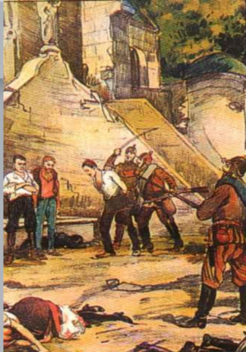
Агітаційна листівка, яка показує звірства німецьких солдатів у Бельгії