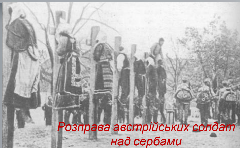
Розправа австрійських солдат над сербами