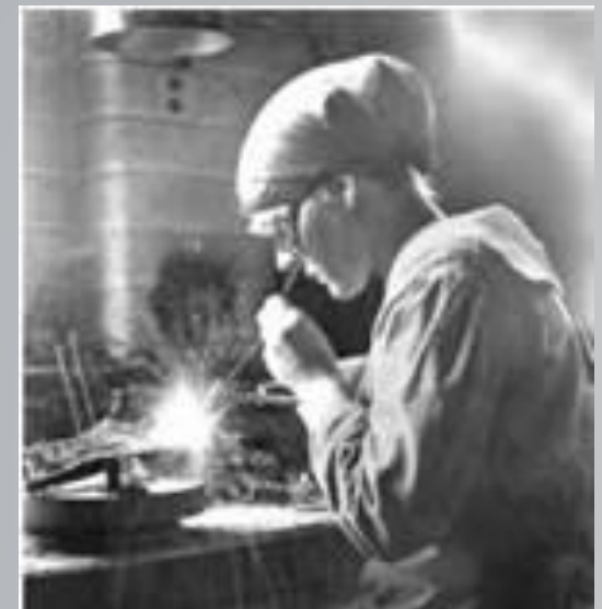
На військовому заводі. Велика Британія. Фото. 1917 р.