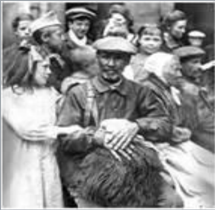
Французькі біженці. Фото. 1915 р

Тільки в Європі 12 млн осіб скуштували гіркого хліба біженців. На початку війни свої домівки залишили майже третина жителів Бельгії; у Франції біженцями стали приблизно 2 млн осіб. Не менш трагічною була доля сербських, польських, українських і німецьких біженців.