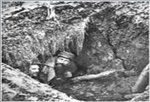
Французькі солдати в окопах біля м. Арраса. Фото. 1915 р.

В умовах позиційної (окопної) війни солдати цілодобово перебували у вузьких і брудних траншеях, у яких їли, спали, справляли природні потреби. Тут також ховали загиблих. У траншеях зграями бігали пацюки. А ще солдатам дошкуляли воші. Неабиякою розкішшю вважалися вино й пиво, тютюн і гра в карти. Емоційною розрадою були листи й посилки від рідних. Поштова служба британської армії за роки війни опрацювала 2 млрд листів і 114 млн посилок.