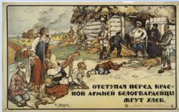
Первые плакаты советской власти

Но не так-то было реализовать все это в жизни!