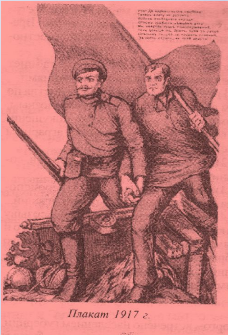
Плакат 1917 г.