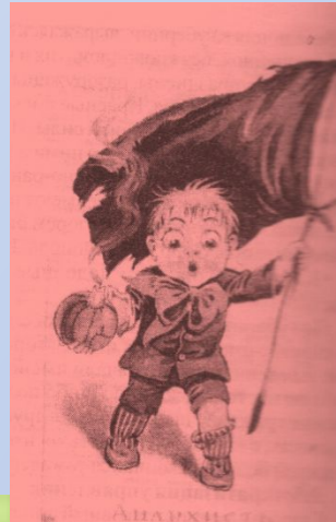
Почтовая марка 1917 г.