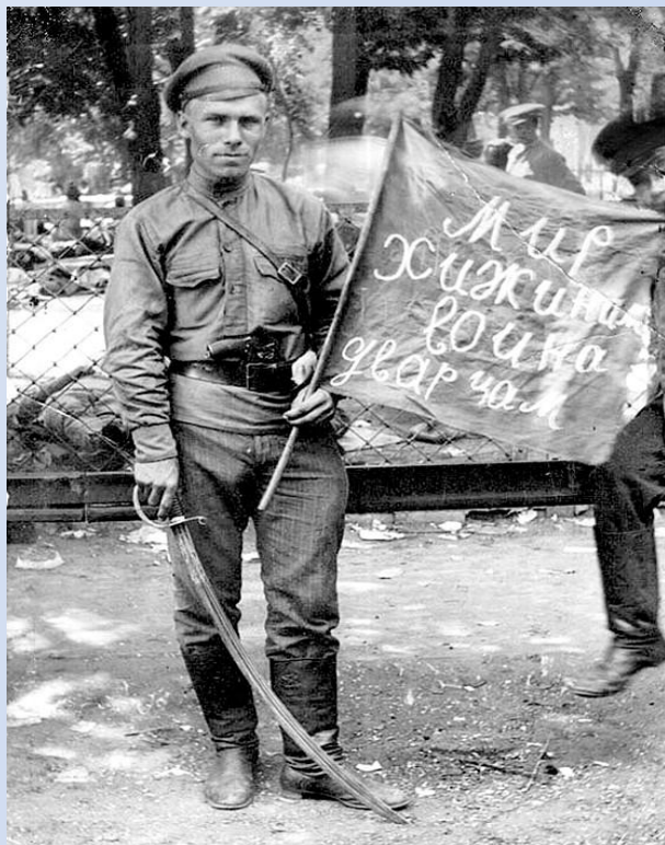
Мир хижинам! Война дворцам!