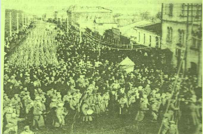
Демонстрация солдат Ставропольского гарнизона.