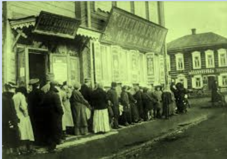
Очереди за хлебом.