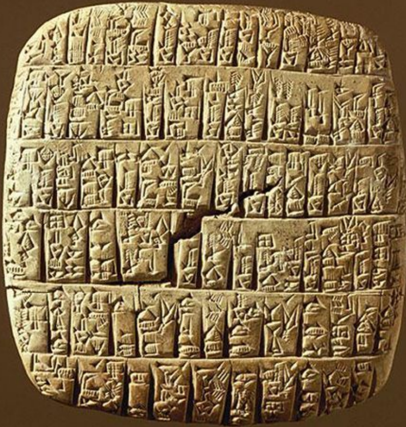
Глиняная табличка Месопотамии