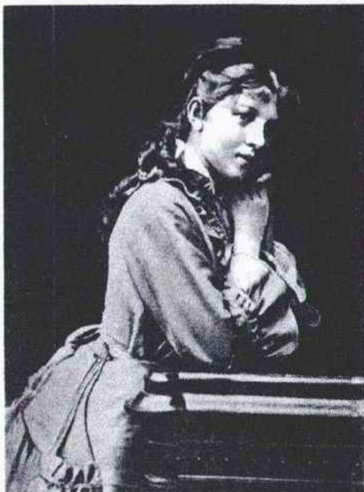
А.А. БЛОК (мать поэта).