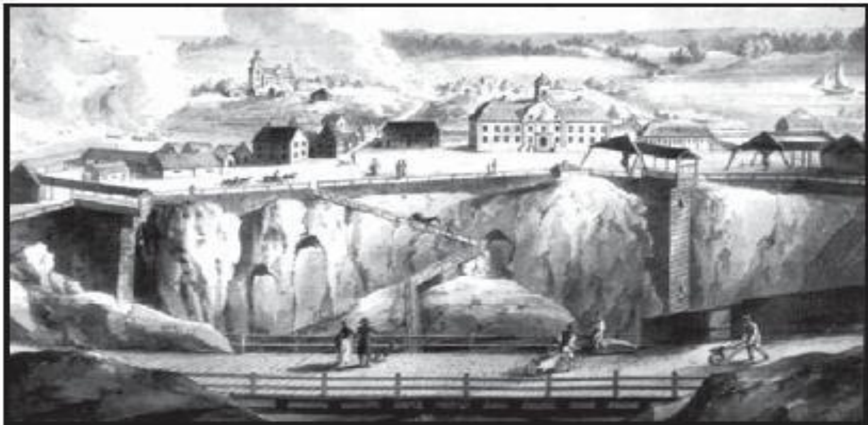
Рис. 1. Швеція. "Мідний рудник в Коппарберзі" (картина Й. Мартіна, XVIII ст.)

Надра Швеції багаті металами і бідні мінеральним паливом. Значні родовища металевих руд, відсутність покладів кам'яного вугілля, нафти і природного газу. Рудні родовища відносяться до найбагатших у світі як по концентрації запасів