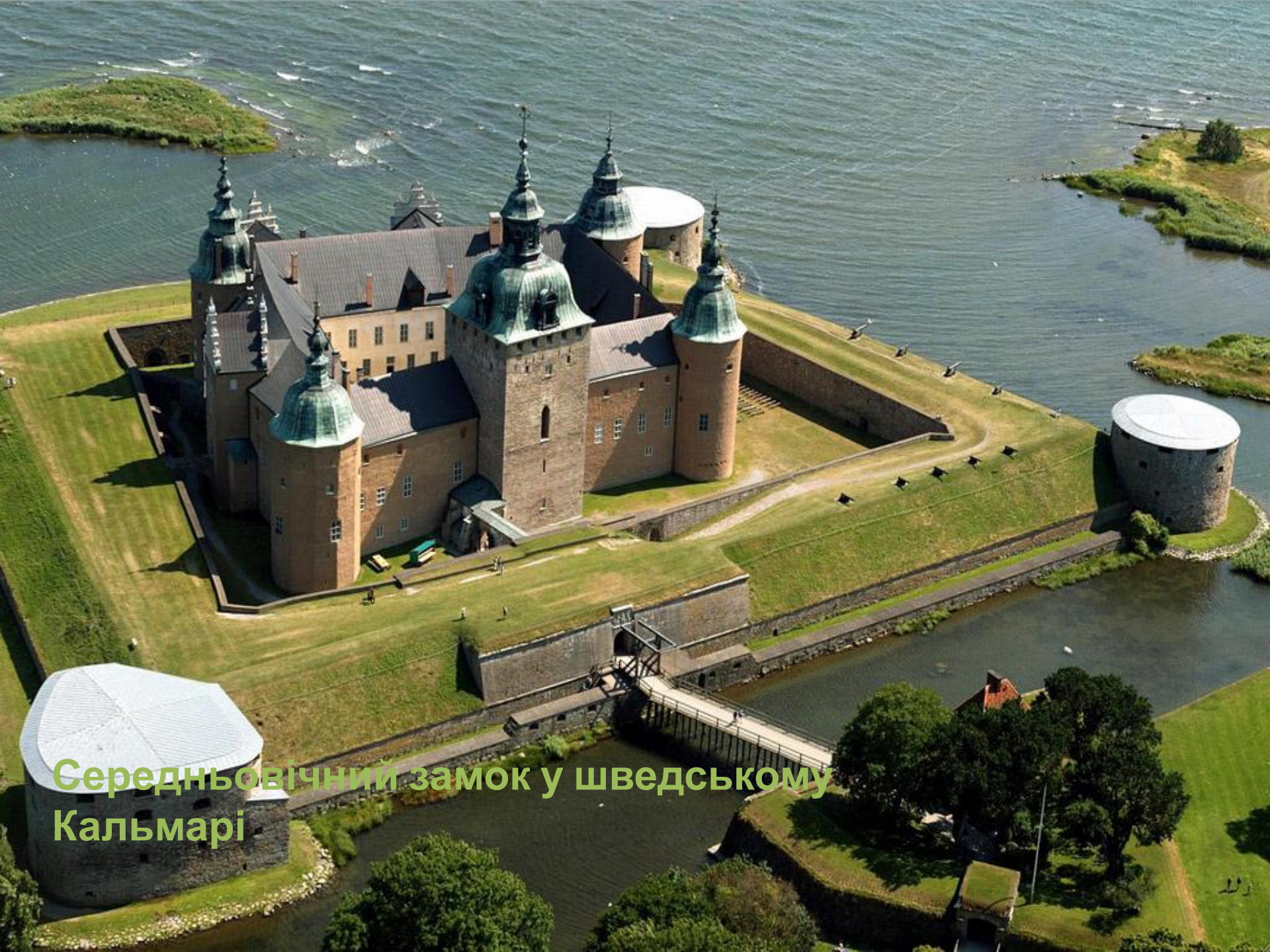
Середньовічний замок у шведському Кальмарі