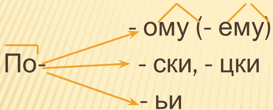
Схема образования наречий.