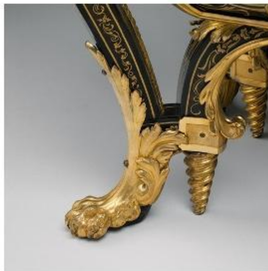
Комод ,1710г 87.6 x 128.3 x 62.9 см , Музей Метрополитен