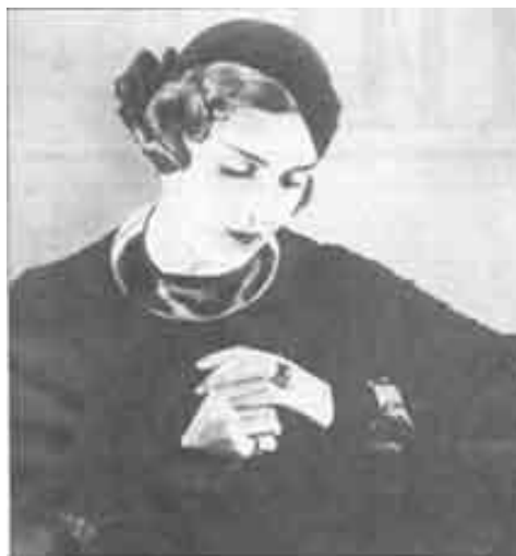
Татьяна Яковлева. 1932 г.

Рано утром 14 апреля 1930 года, за три часа до выстрела, Маяковский отправил в Париж на имя Татьяны Яковлевой телеграмму: «Маяковский застрелился».