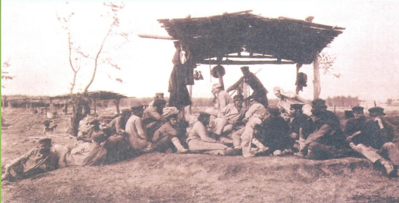
Рудокопы возле рудника-«дудки». Фотография XIX в.