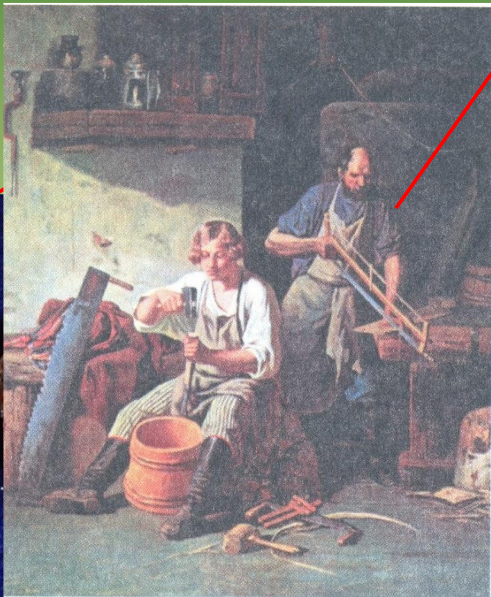
В бондарной. Художник А. Плахов. Бондарный промысел – изготовление деревянных бочек