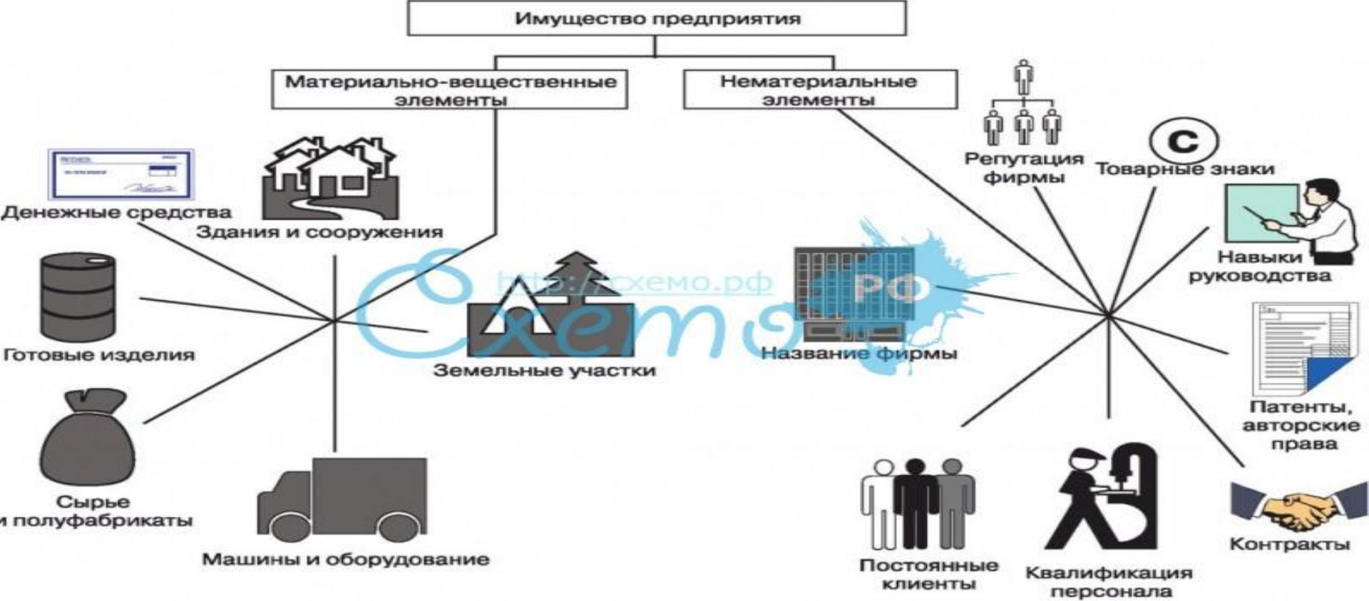
Рис. 4.5. Состав имущества предприятия

Имущество предприятия - материальные и нематериальные элементы, используемые предприятием в производственной деятельности.