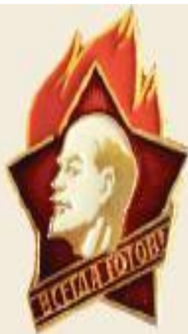
Пионер Школьники с 9 до 14 лет.