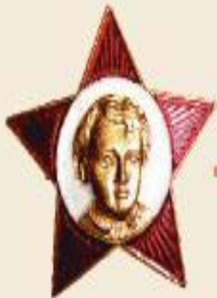
Октябренок Школьники с 7 до 9 лет.