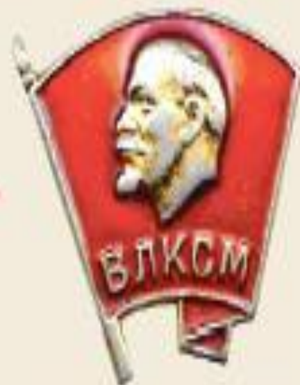
Комсомолец Молодежь с 14 до 28 лет.