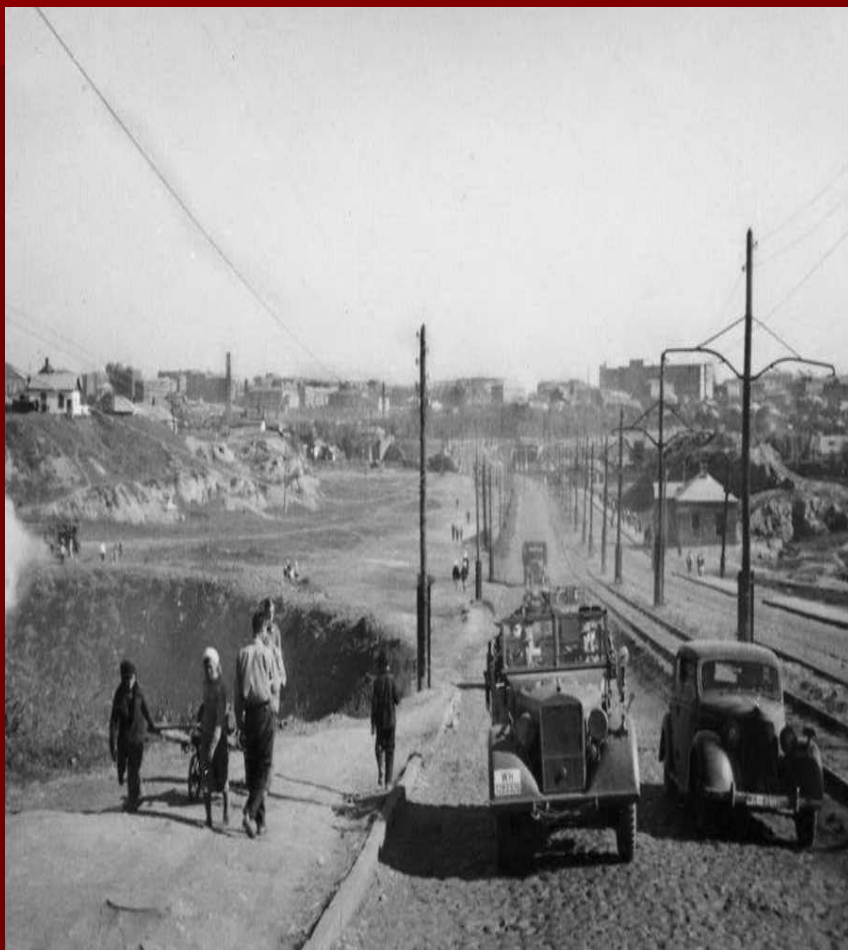
Фото Донецка (Сталино) в оккупации