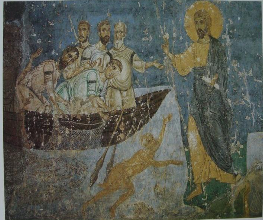
Явление Христа ученикам на Тивериадском озере. Спасо-Преображенский собор Спасо-Мирожского монастыря

Живопись Киевской Руси представлена, в основном, мозаикой, фресками и иконописью. Особенно ярко проявилась мозаика в Софийском соборе в Киеве, где в наиболее освещённой части храма помещалась Евхаристия, Богоматерь Оранта (молящаяся). Но уже с XII века мозаика отходит на второй план, уступая место фреске и иконописи. Фрески (рисунок по сырой штукатурке) заполняют всё внутреннее помещение церкви. Рисунки выполнены в основном на библейские темы. Особое развитие получила на Руси иконопись. Вначале были распространены византийские Однако, с развитием культуры происходит и эволюция в иконописи – появляются свои, русские иконы, не уступающие глубиной и выразительностью образа византийским творениям. А древнерусская иконопись более открыта миру, жизнерадостна, декоративнее, чем византийская.