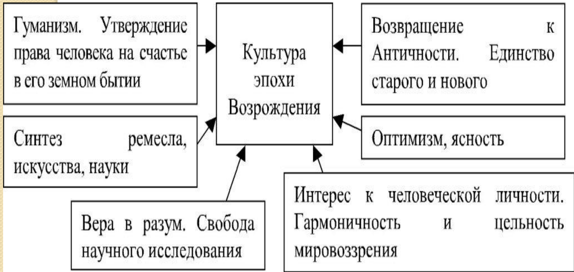
Сущностные черты культуры эпохи Возрождения