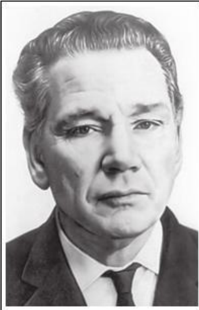
Петр Кузьмич Анохин