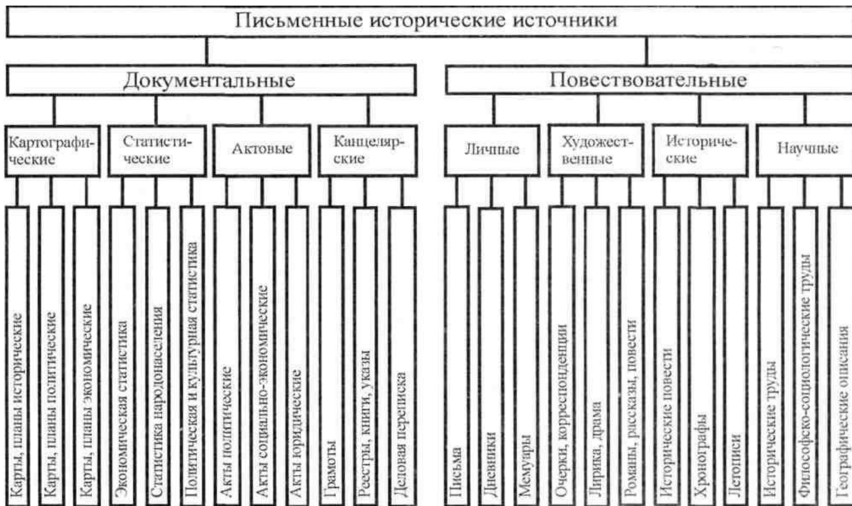
Рис. 4. Линейная схема классификации письменных исторических источников (по Л. Н. Пушкареву)