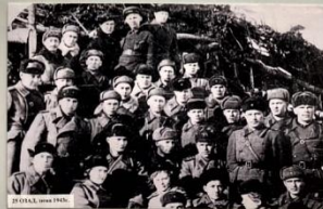
20 ОАД, декабрь 1942.