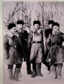
Группа офицеров 69 ОАД, 1942 г.