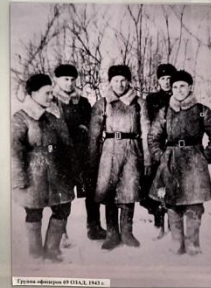
Группа офицеров 01 ОАД, 1942 г.