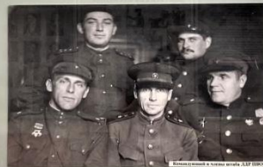
Солдаты в казармах, ЛДР ПВО.