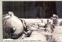
Работа батареи А. П. Лукина «Триумф», ПЧЗ.

В дальнейшем для прикрытия ледовых трасс были выставлены три батареи малокалиберной зенитной артиллерии 21-ого отдельного зенитного артиллерийского дивизиона, отдельный зенитный пулеметный батальон, 124-я отдельная зенитная пулеметная рота, зенитные пулеметные звенья 25-ого и 225 ОАД-ов. Батареи зенитной артиллерии размещались по льду по обе стороны автомобильной дороги по возможности в шахматном порядке, с интервалом до 3 км. Зенитные пулеметы были установлены попарно с интервалом в 1-1,5 км.