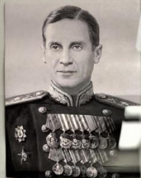
Сергей Евгеньевич Пархоменко - командующий ЛДР ПВО, член Военного совета ЛДР ПВО.

В состав Ладожского дивизионного района ПВО вошли: •отдельные зенитно-артиллерийские дивизионы (ОАД): 1, 20, 25, 37, 65, 69, 214, 225, 391, 253, 251, 432, 434, 447, 36 гвардейский; •отдельные батальоны (ОБ ВНОС): 42, 47; •отдельные роты: 12, 124.