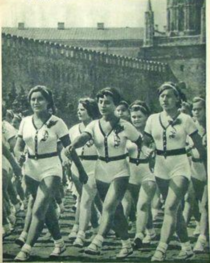
Физкультурник и знаток в СССР стали популярнейшими жителями страны. Партия и правительство уделяют физкультуре большое внимание, создают все условия для ее развития. Советским Союзом учрежден День физкультурника. День физкультурника — это всесоюзный праздник трудящихся страны социализма. В этот день в Москве на Красной площади состоится традиционный Всесоюзный парад физкультурника. В этот день 85-000 физкультурников, из них 1500 физкультурников разных профессий, участвующих в организации Всесоюзного парада физкультурника, будут участвовать в различных видах спорта и гимнастики.

Воспитание молодежи в условиях «Молоди» является одной из важнейших задач. Для этого необходимо использовать все возможности организации туристской жизни. Туризм способствует развитию физических и моральных качеств молодежи, воспитанию патриотизма, любви к Родине, уважения к труду.