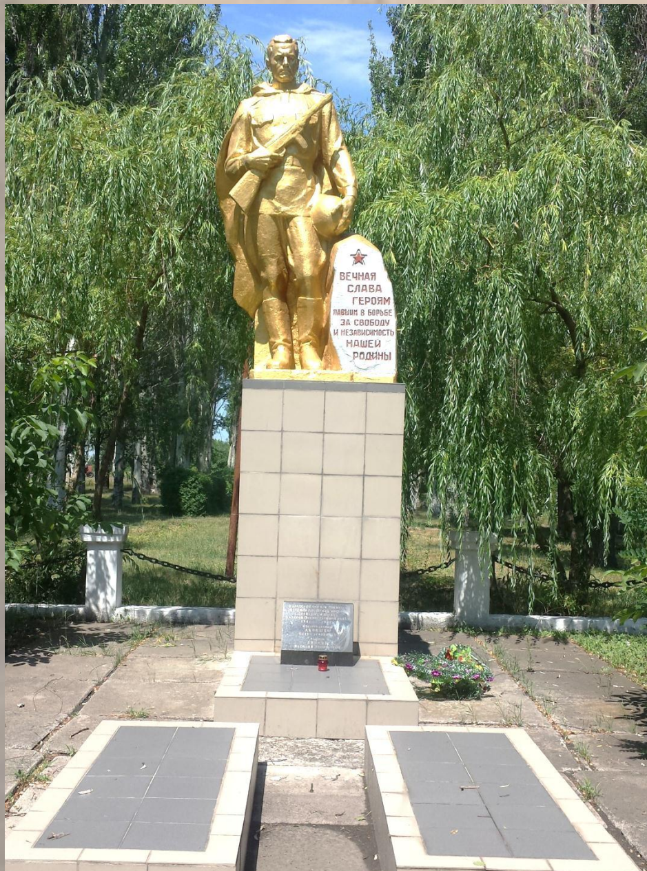
Памятник на поселке в районе шахты № 3-бис.