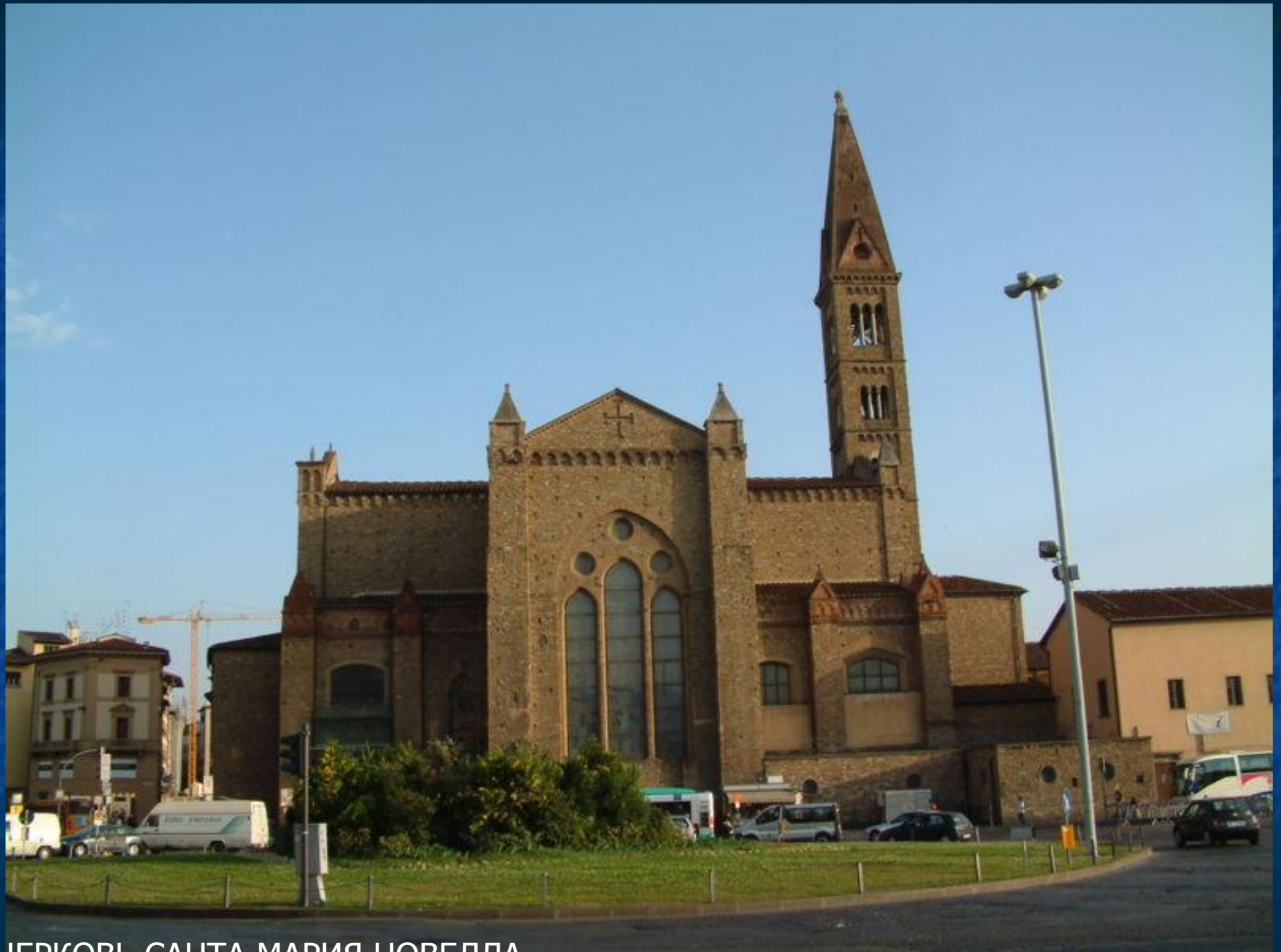
ЦЕРКОВЬ САНТА МАРИЯ НОВЕЛЛА