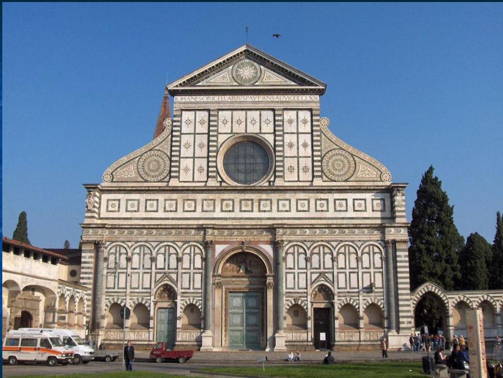
ЛЕОН БАТТИСТА АЛЬБЕРТИ. ФАСАД ЦЕРКВИ САНТА МАРИЯ НОВЕЛЛА (1450-1470)