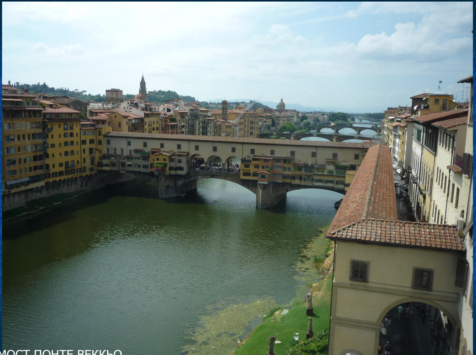
МОСТ ПОНТЕ ВЕККО