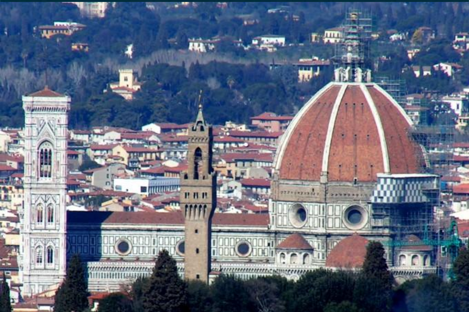
ФИЛИППО БРУНЕЛЛЕСКИ. КУПОЛ СОБОРА САНТА МАРИЯ ДЕЛЬ ФЬОРЕ (1420-1471)