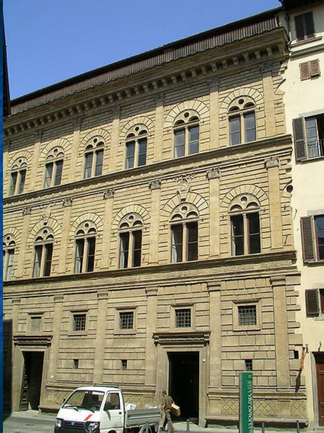
ЛЕОН БАТТИСТА АЛЬБЕРТИ. ПАЛАЦЦО РУЧЕЛЛАИ (1446-1451)