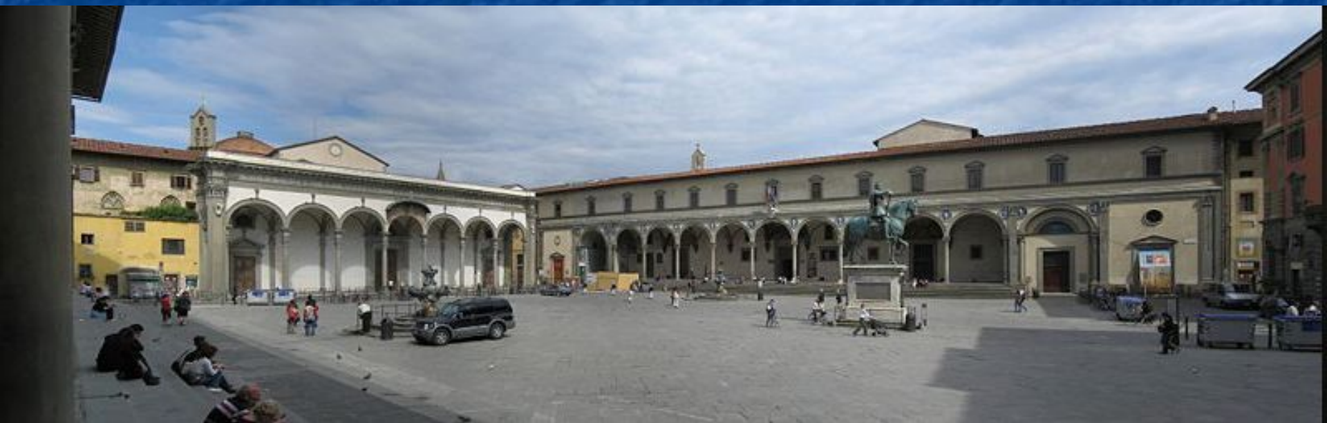
ПЛОЩАДЬ САНТИССИМА АННУНЦИАТА