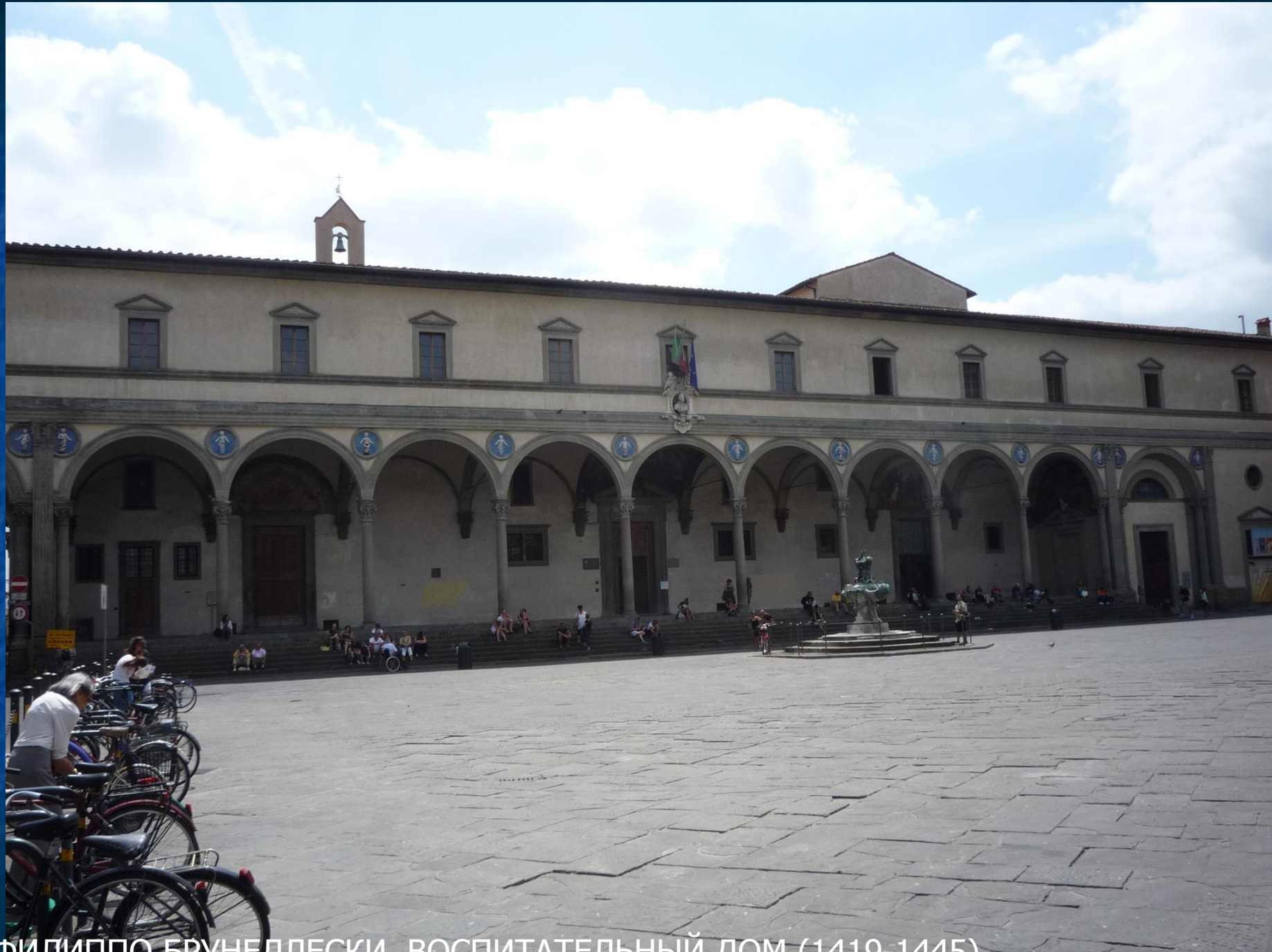
ФИЛИППО БРУНЕЛЛЕСКИ. ВОСПИТАТЕЛЬНЫЙ ДОМ (1419-1445)