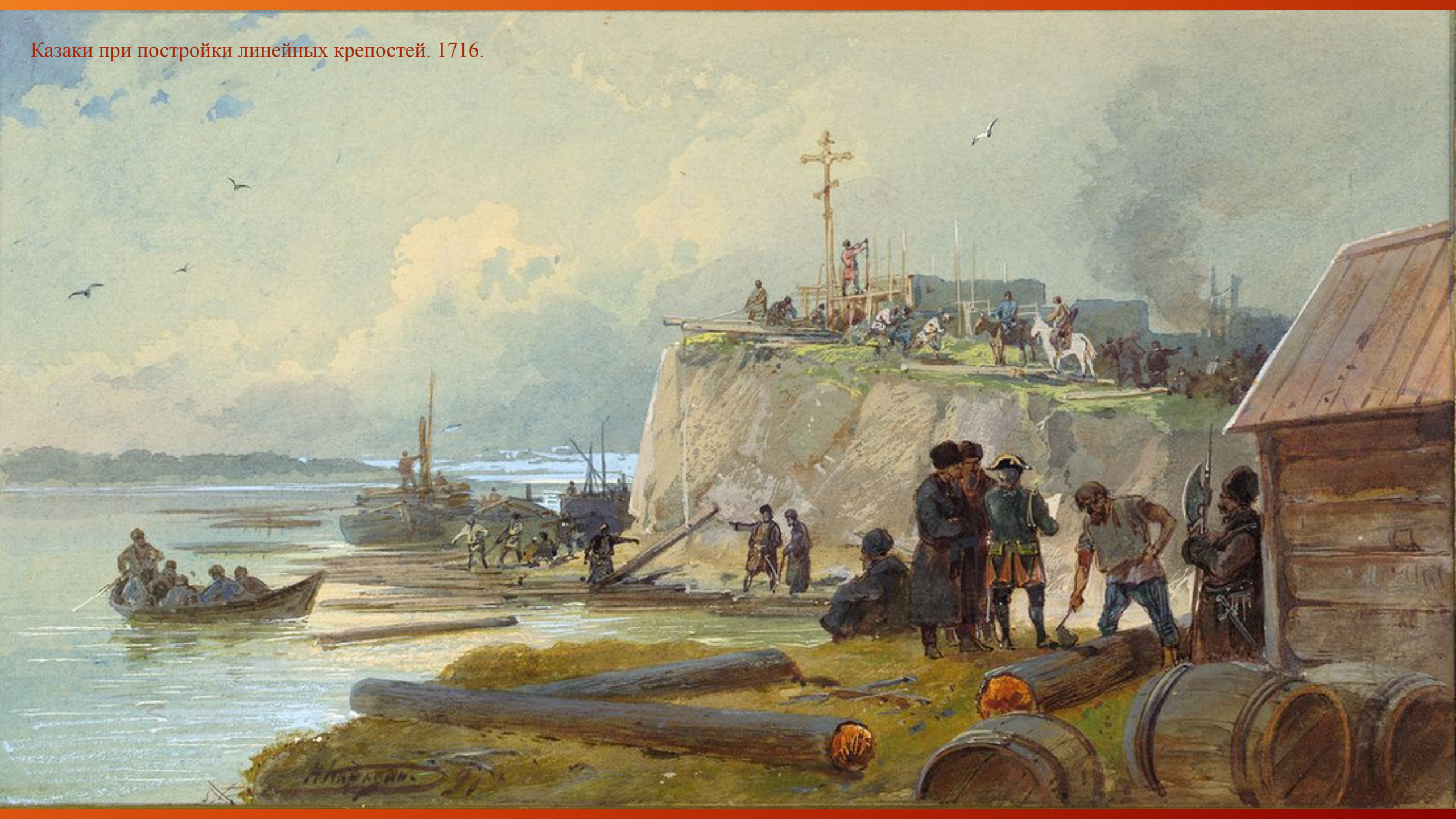
Казачи при постройке линейных крепостей. 1716.