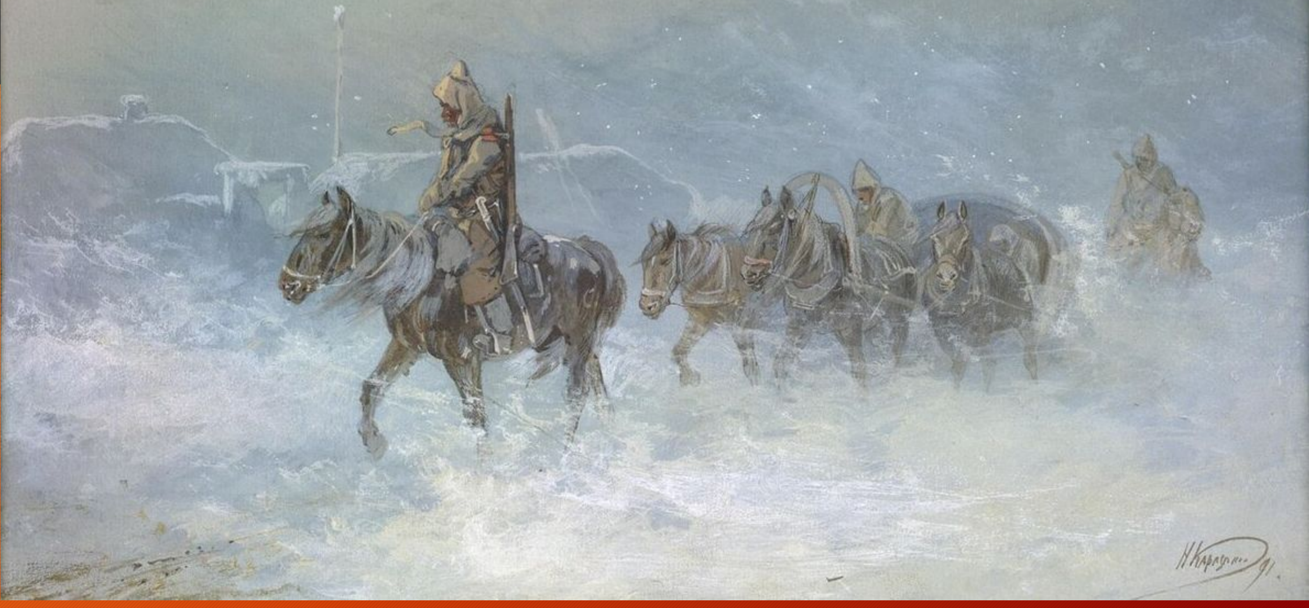
Ямская и конвойная служба в степи. 1840-1850-е.