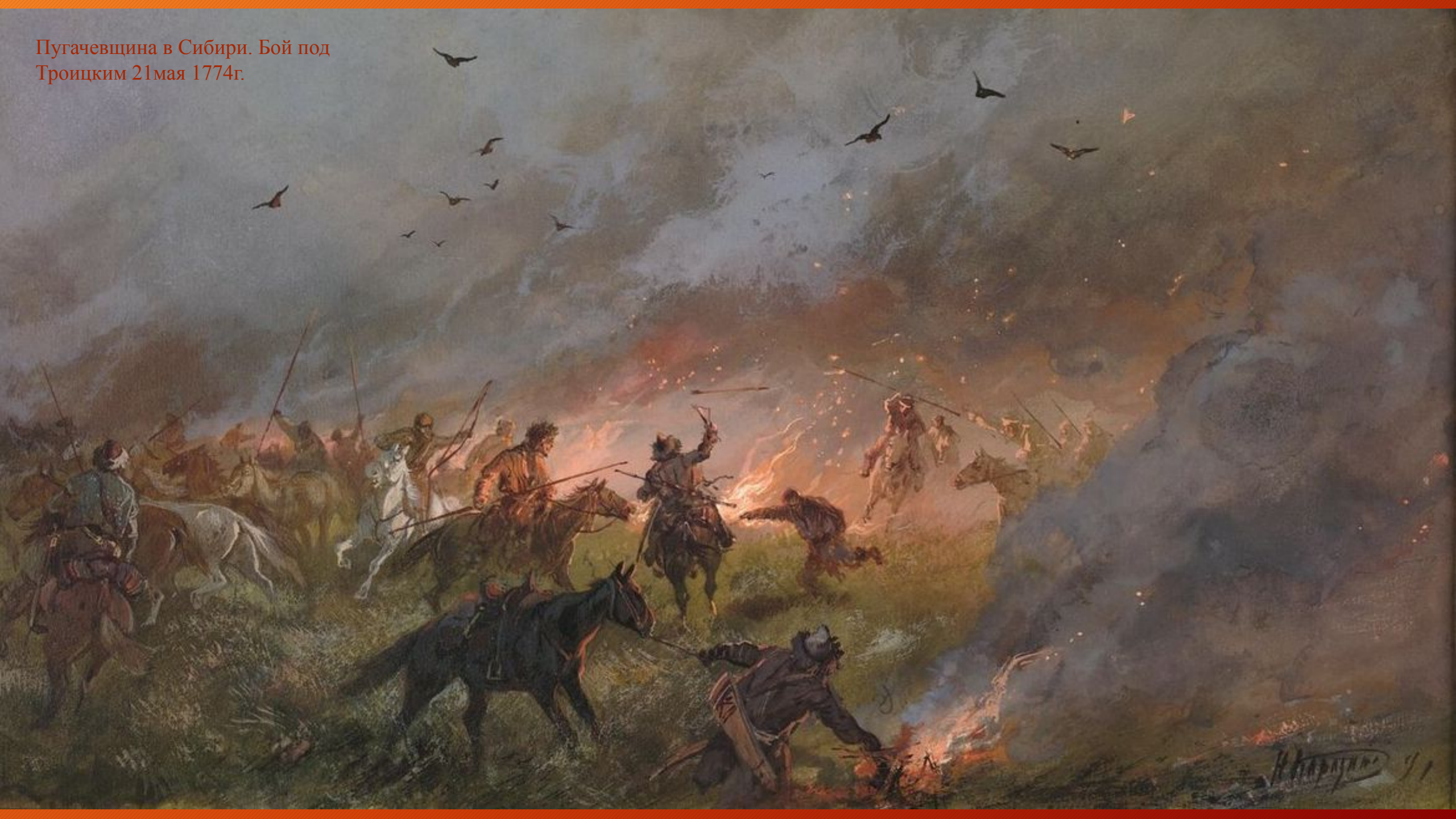
Пугачевщина в Сибири. Бой под Троицким 21 мая 1774г.