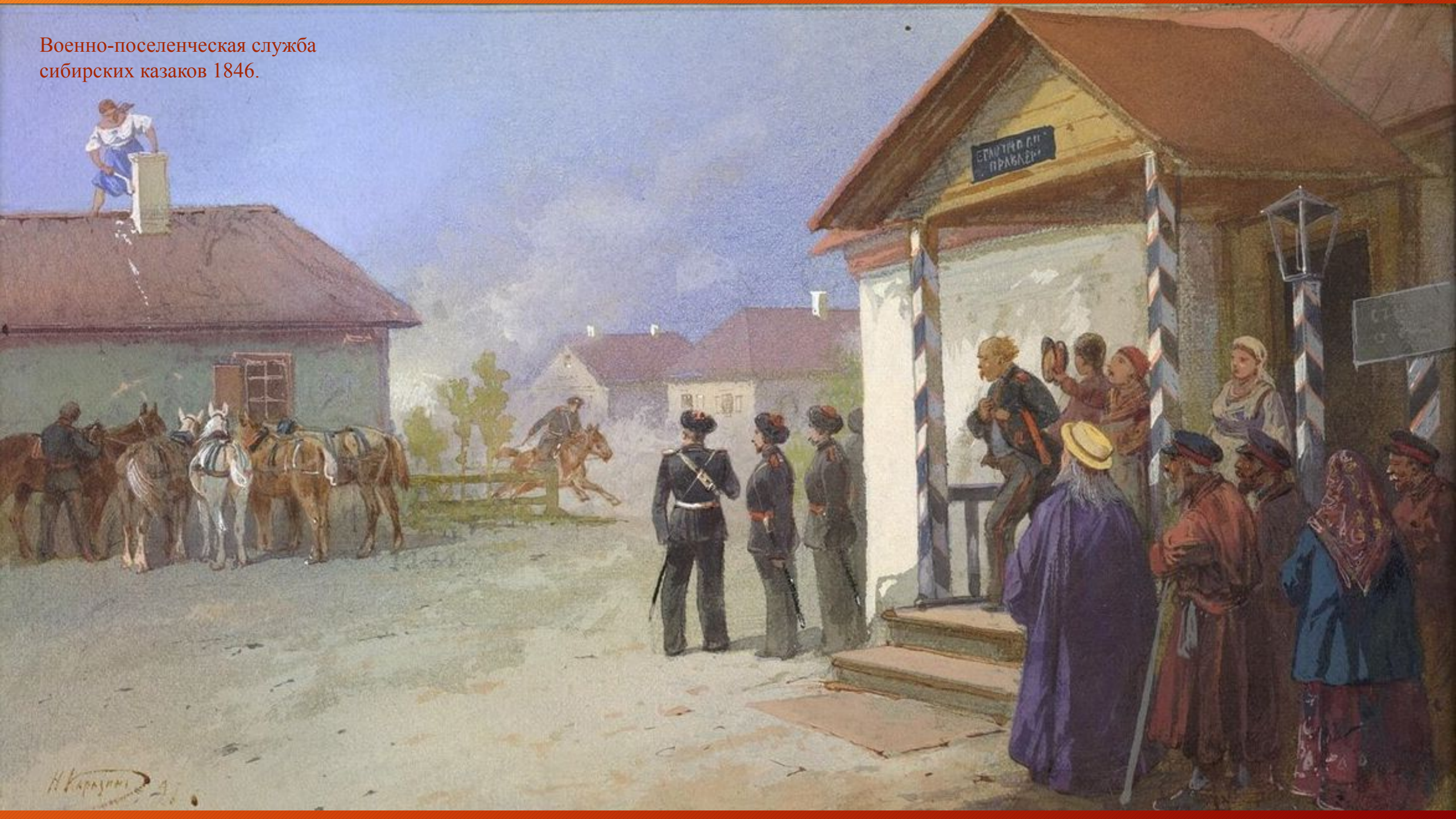
Военно-поселенческая служба сибирских казаков 1846.