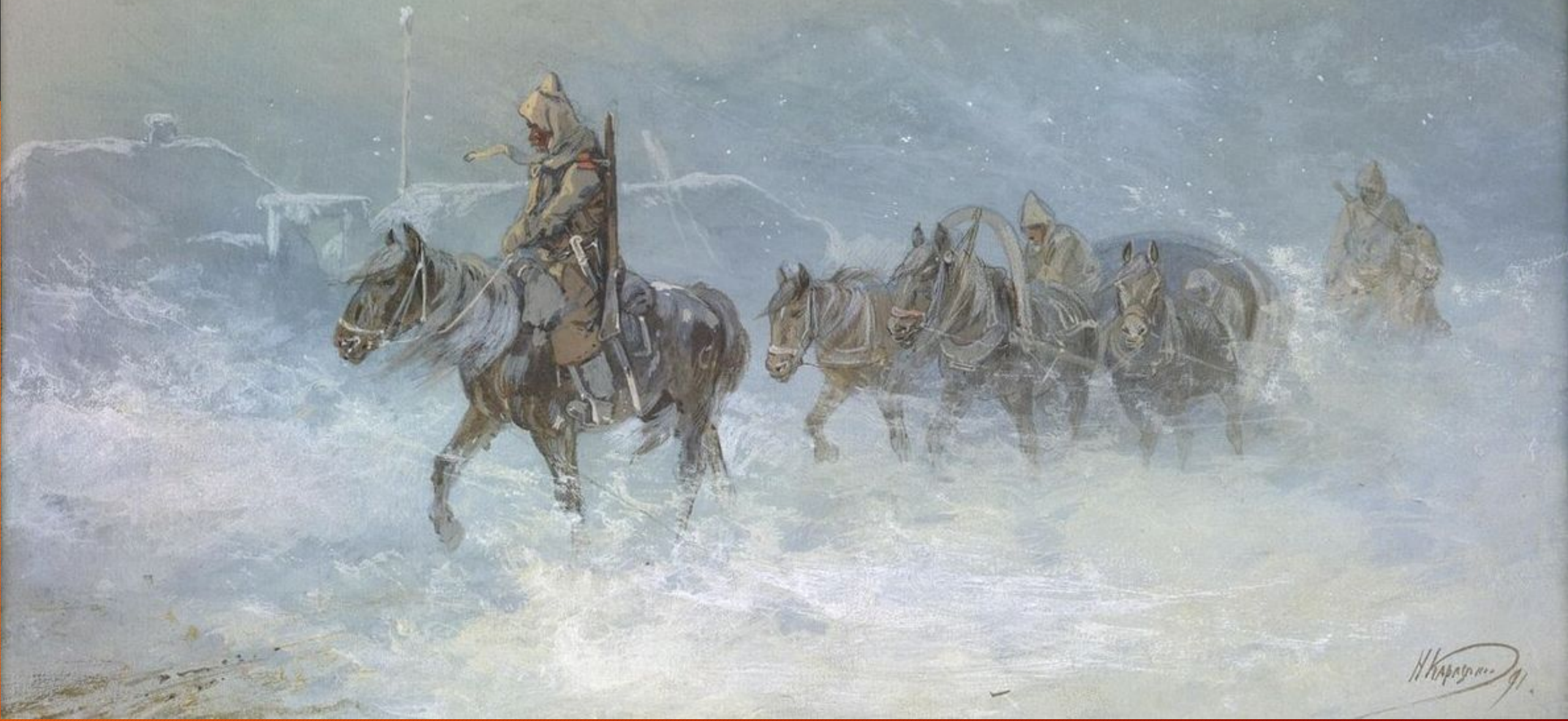
Ямская и конвойная служба в степи. 1840-1850-е.