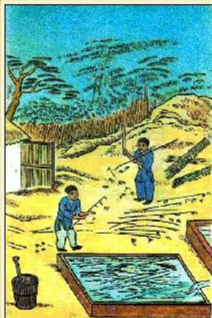
Измельчен ие бамбука