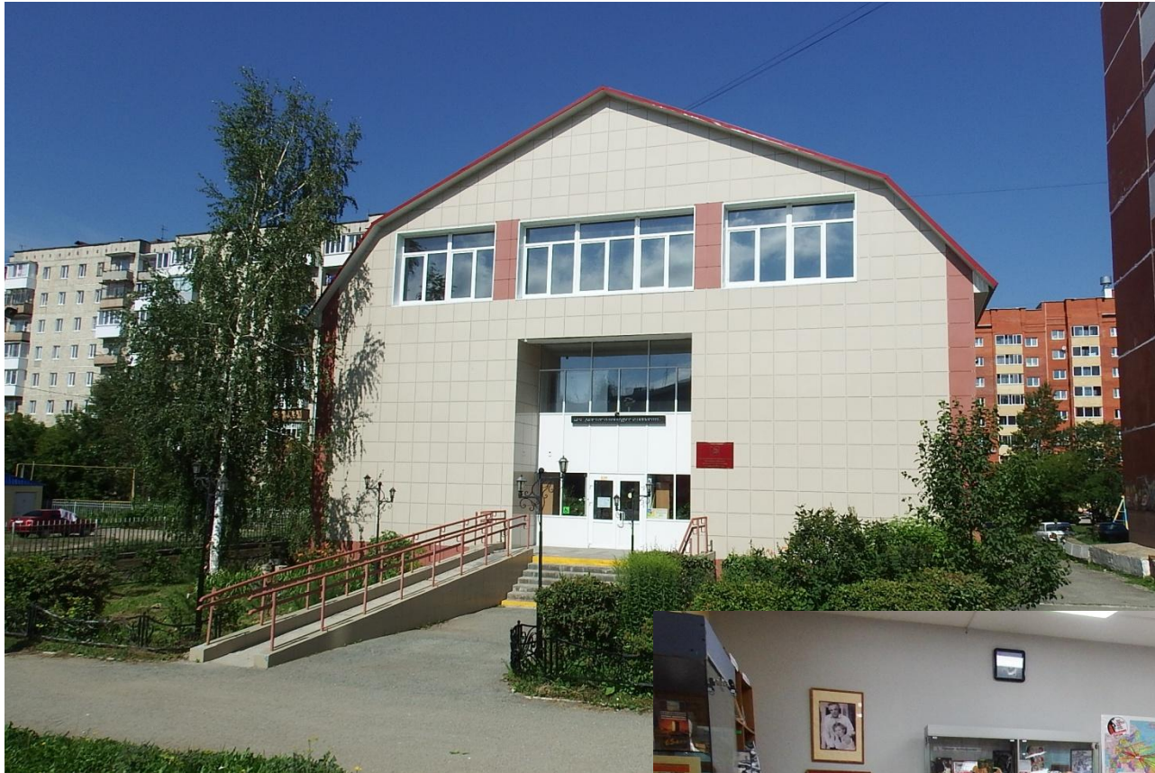
Библиотека имени А. С. Пушкина в наше время