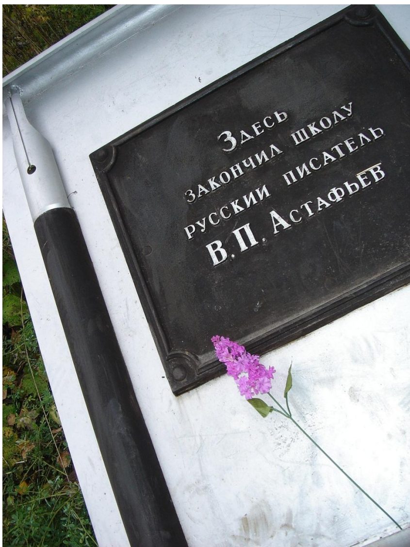
Памятный знак «Начало» Открыт в 2004 г. в рамках I Малых Астафьевских Чтений