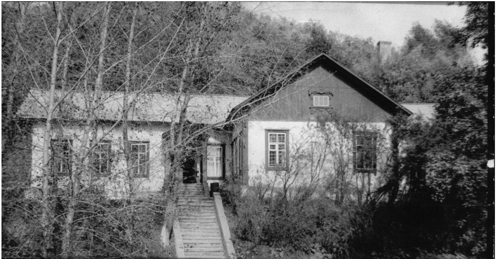
Школа рабочей молодежи №20 (бывшее 2-классное железнодорожное училище. Ул. Матросова, 7)