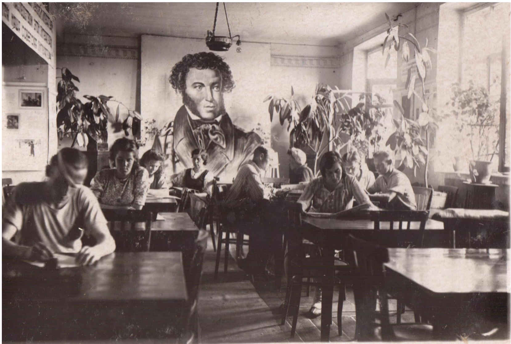
Читальный зал библиотеки