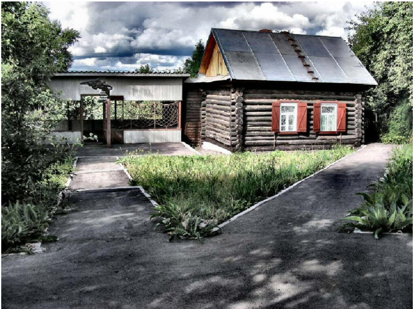
Дом-музей Астафьева (открыт в 2002г.)