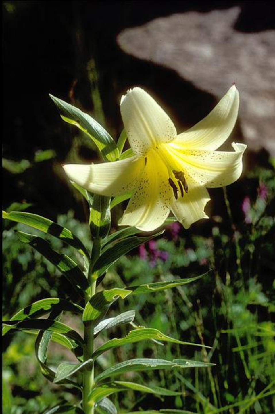
Лилия армянская (Lilium monadelphum subsp. armenum)