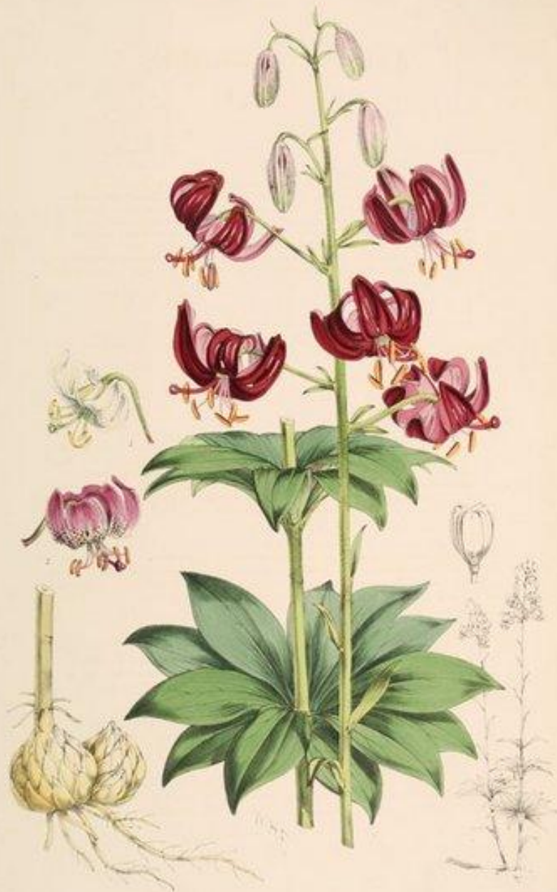
Lilium martago var. dalmaticum

Род Лилия состоит из более чем 110 видов распространённые х преимущественно в Европе, а главное в Азии.