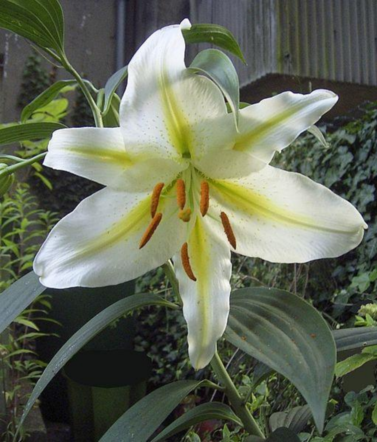
Лилия ЗОЛОТИСТАЯ Lilium auratum