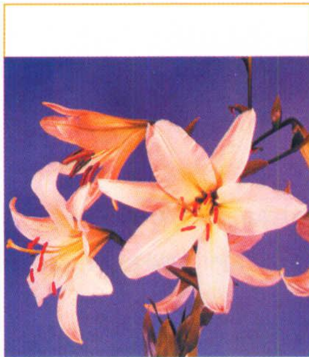
Горизонтальное (направлены в сторону)