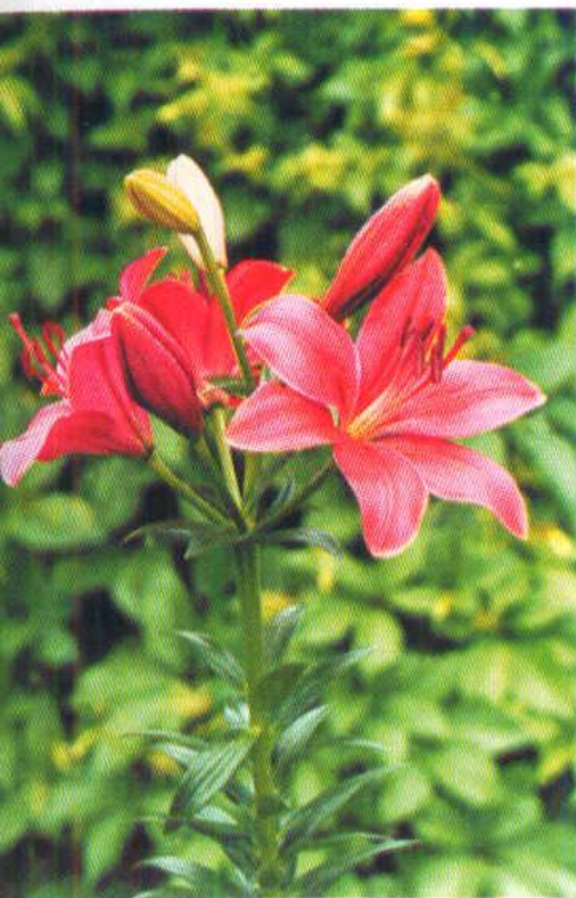
Вертикальное направлены вверх)