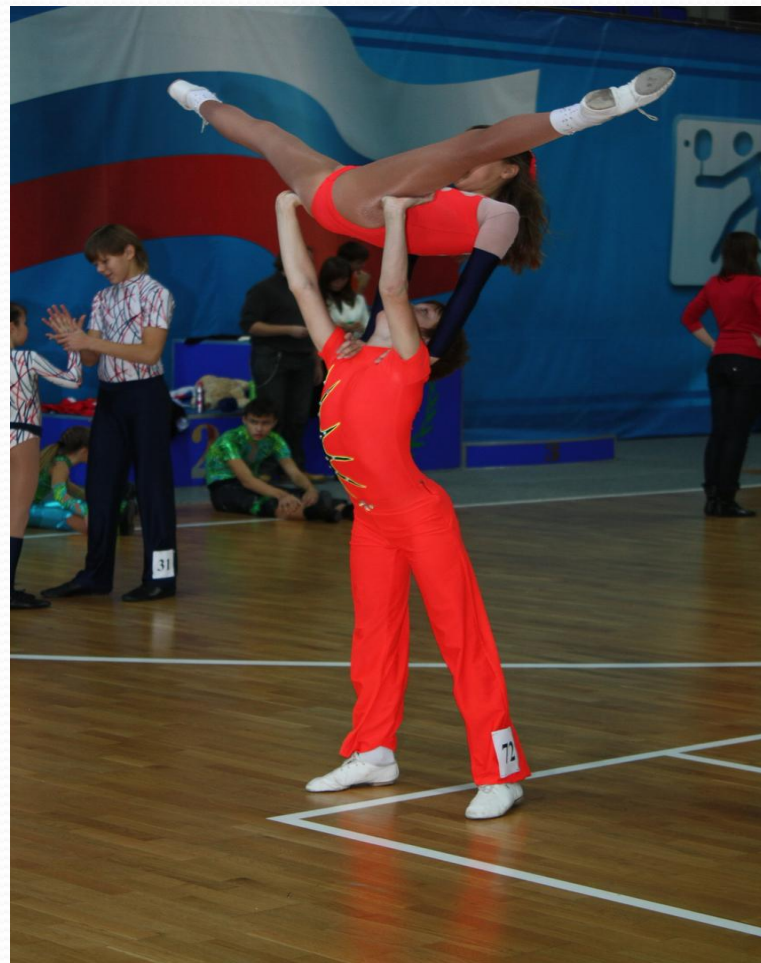
Парных акробатических упражнений