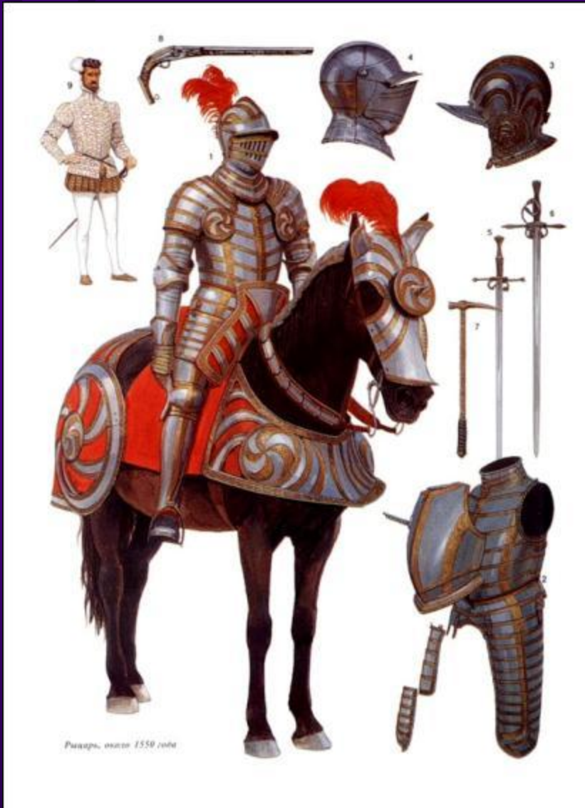
Рыцарь, около 1550 года

Военное дело стало занятием исключительно феодалов на протяжении многих веков. Часто феодалы сражались всю жизнь.