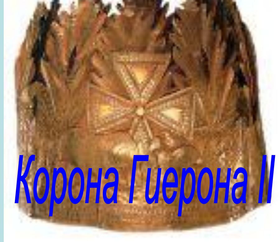
Корона Гиерона II