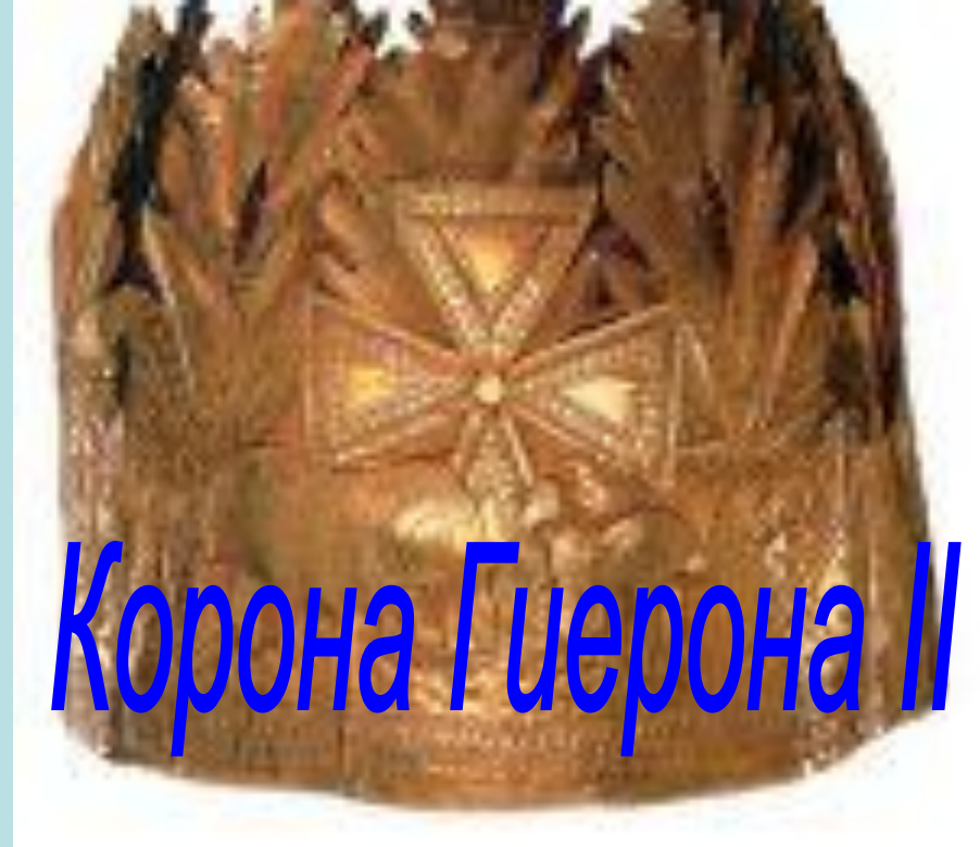
Корона Гиерона II