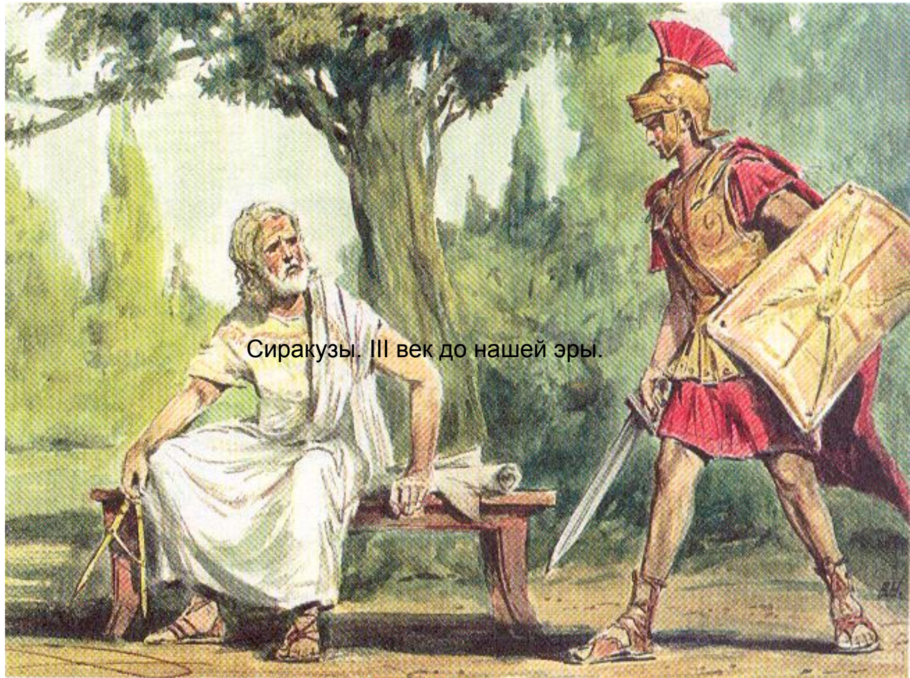
Сиракузы. III век до нашей эры.