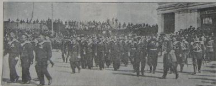
Привытіе героевъ Чесулыно въ Москвѣ.—У выхода съ куренатаго вокзала.