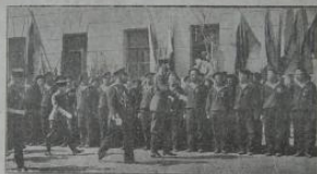
Ген. Инженеръ Герасимъ Владим. Векъ Сергій Александровичъ съ сопровождающими въплоть Рулева въплоть ярыя шатроны «Защита» и «Бурлаки».