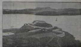
Завская крутизна на берегу р. Ялу при впаденіи р. Дель.