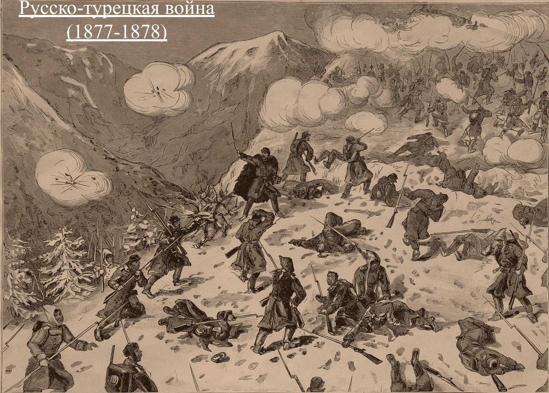
4-я стрѣлковая бригада идетъ на штурмъ Шипкинскихъ позицій 26 / 27 Декабря 1877 года.