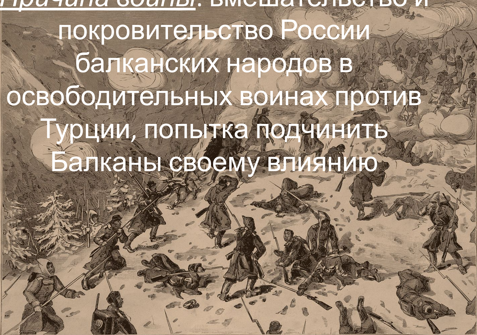
4-я стрѣлковая бригада идетъ на штурмъ Шипкинскихъ позицій 26 / 27 Декабря 1877 года.