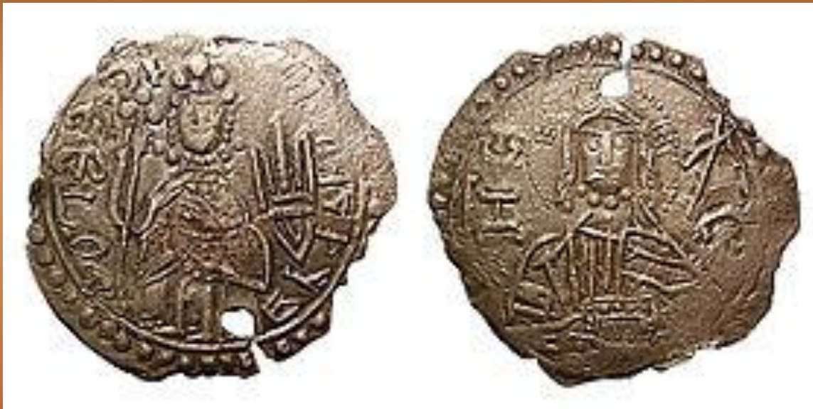
Сребренник и золотник с портретом князя Владимира