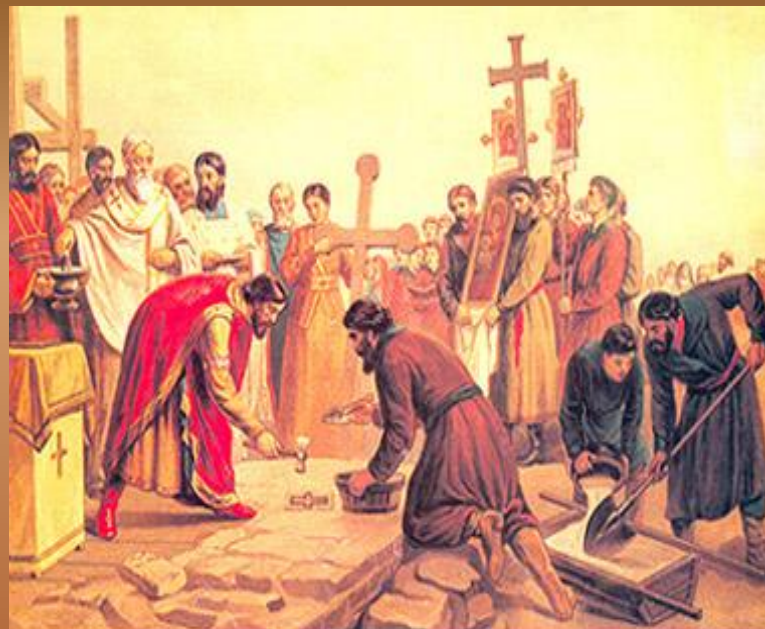
В.И. Верещагин Закладка Десятинной церкви в Киеве