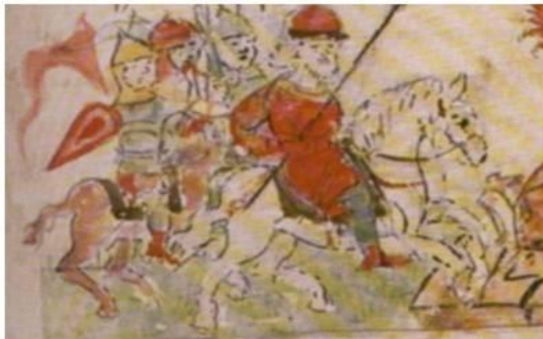
Поход Владимира на вятичей

В 991 г. поход в днестровские земли против белых хорватов