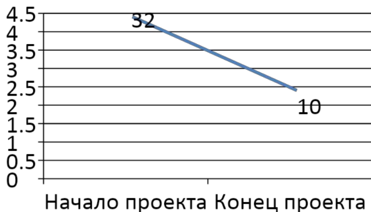
Заполнение переводных эпикризов в электронном виде