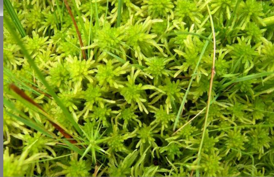
сфагнум дифузиаструм сплюснутый