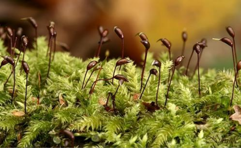
Кукушкин лен печеночник