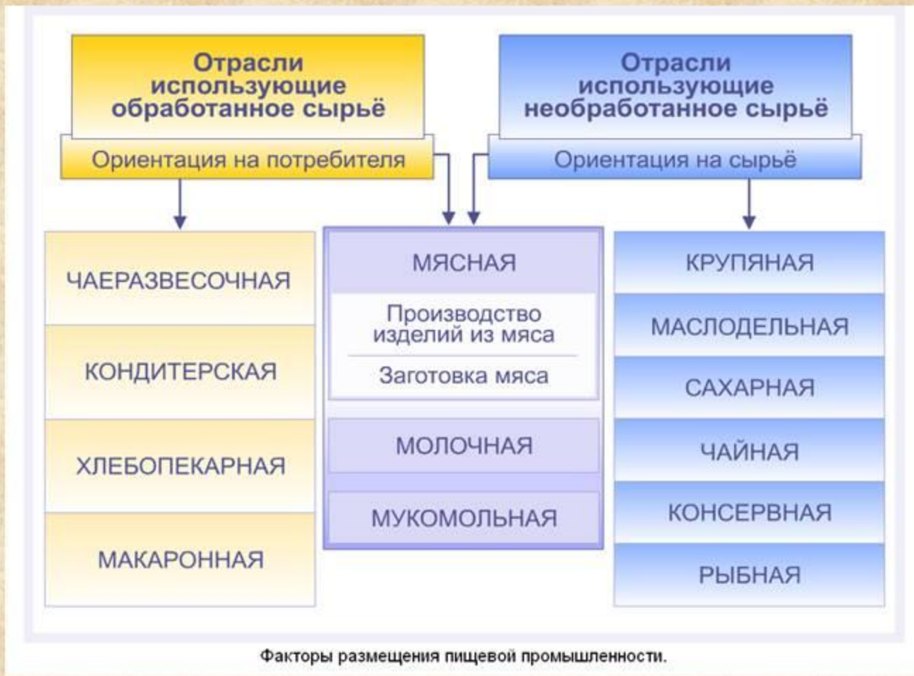
Факторы размещения пищевой промышленности.