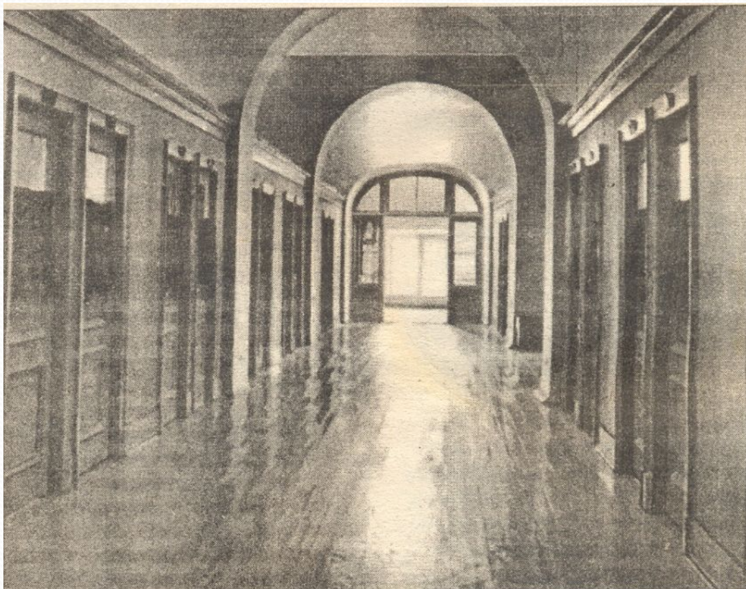
Царскосельский лицей. Коридор четвертого этажа и спальни лицеистов. Фотография