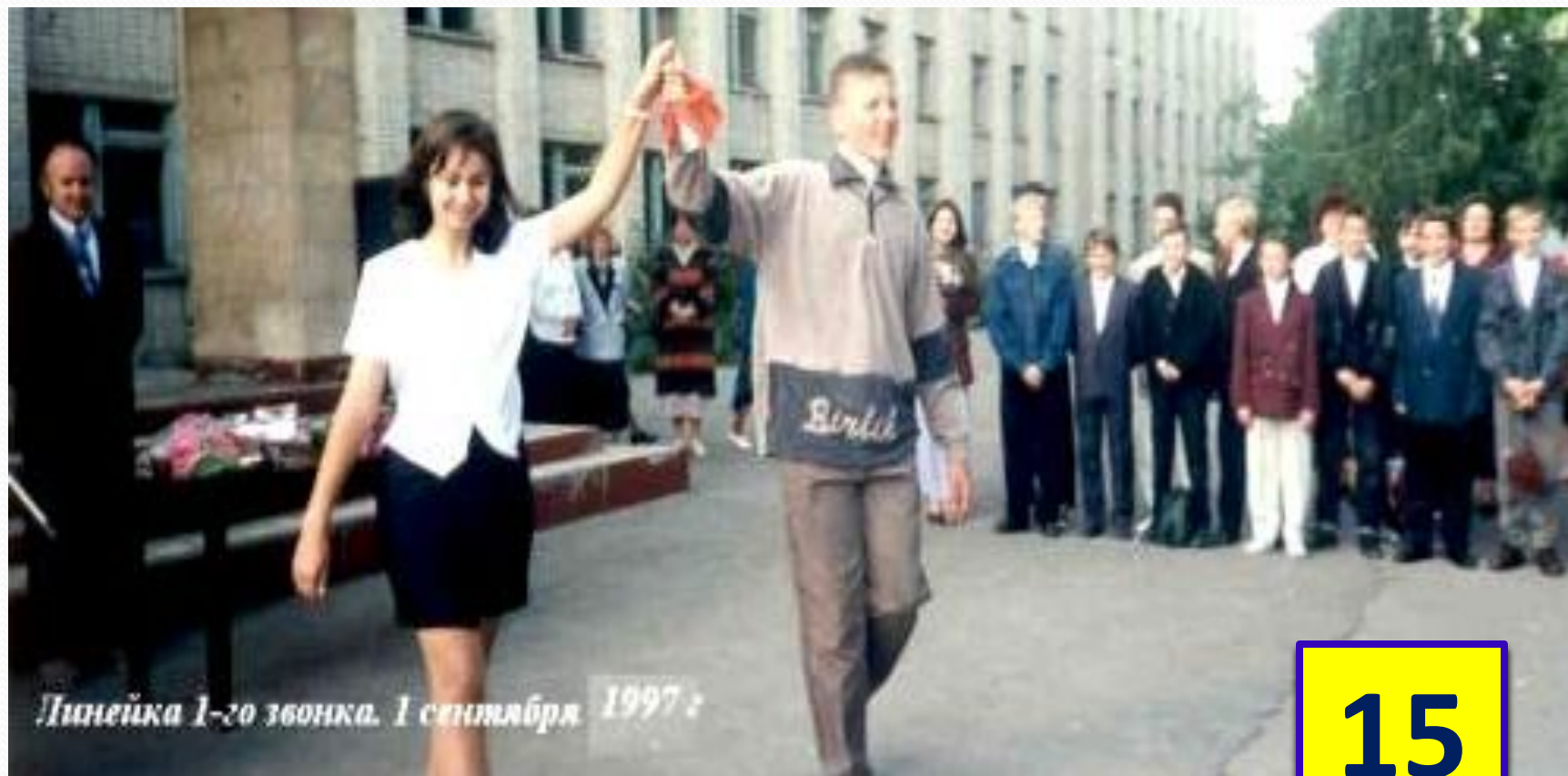
Линейка 1-го звонка. 1 сентября 1997: