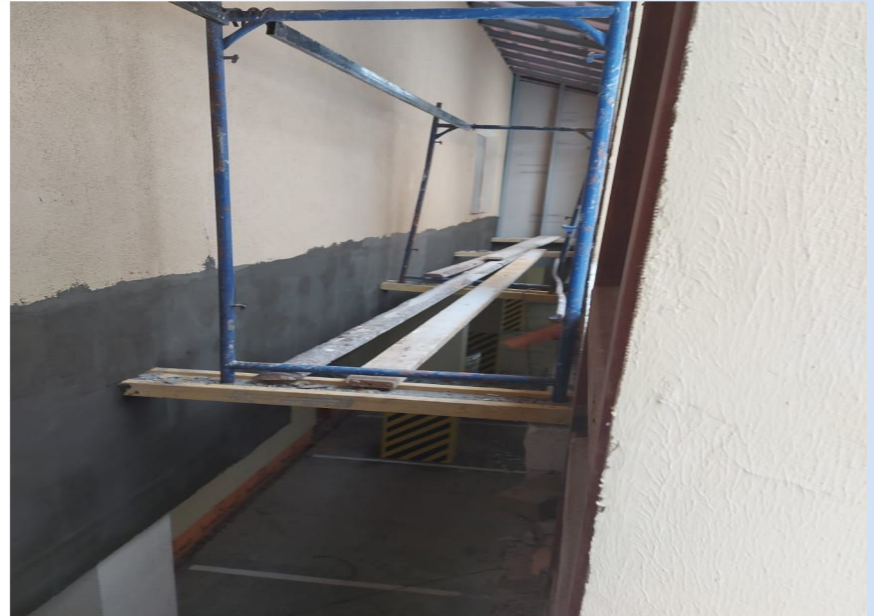
Корпус №3. Не завершены работы по устройству фасада.