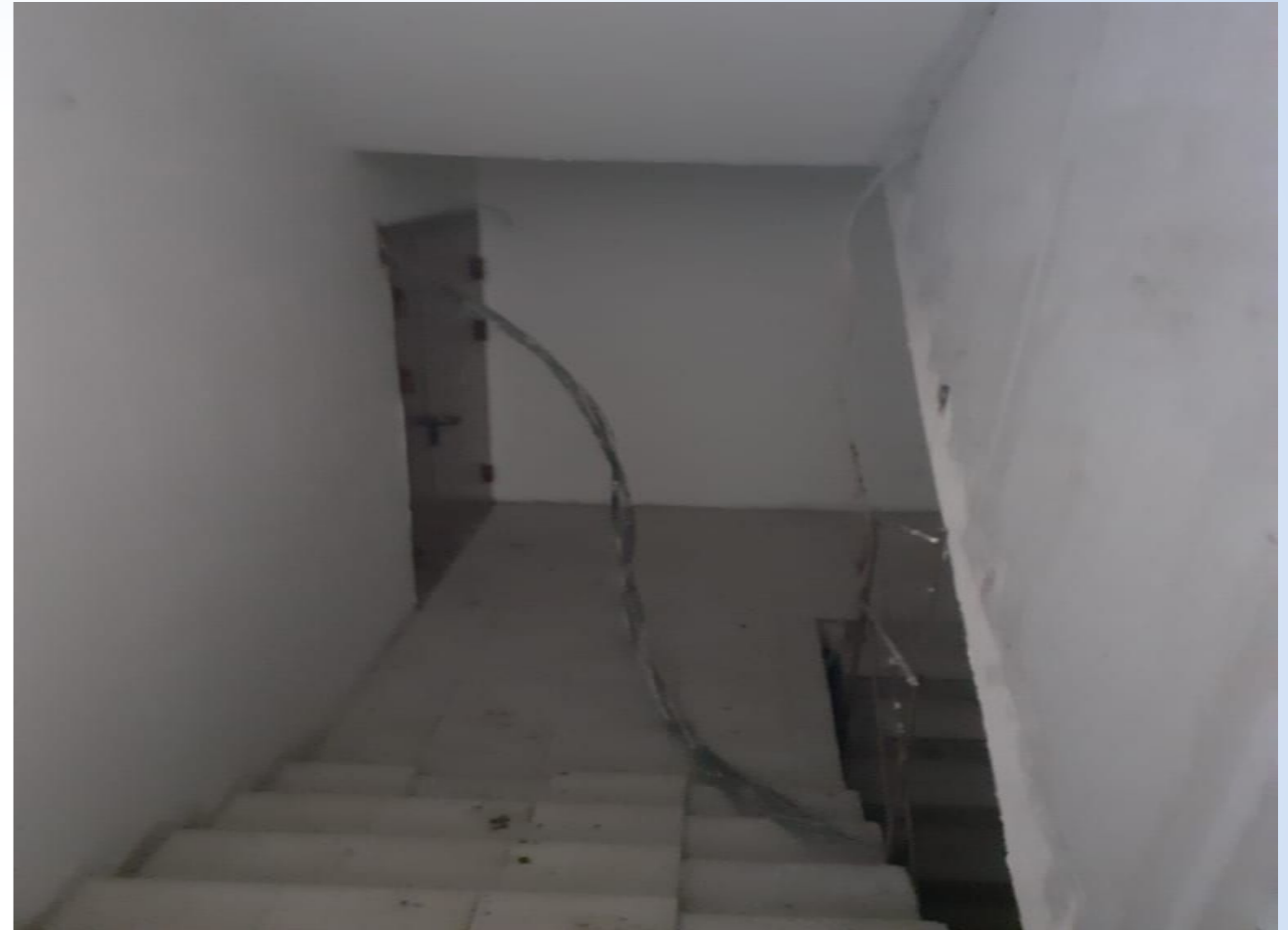
Корпус №6. Не завершены работы по отделке внутренних помещений .