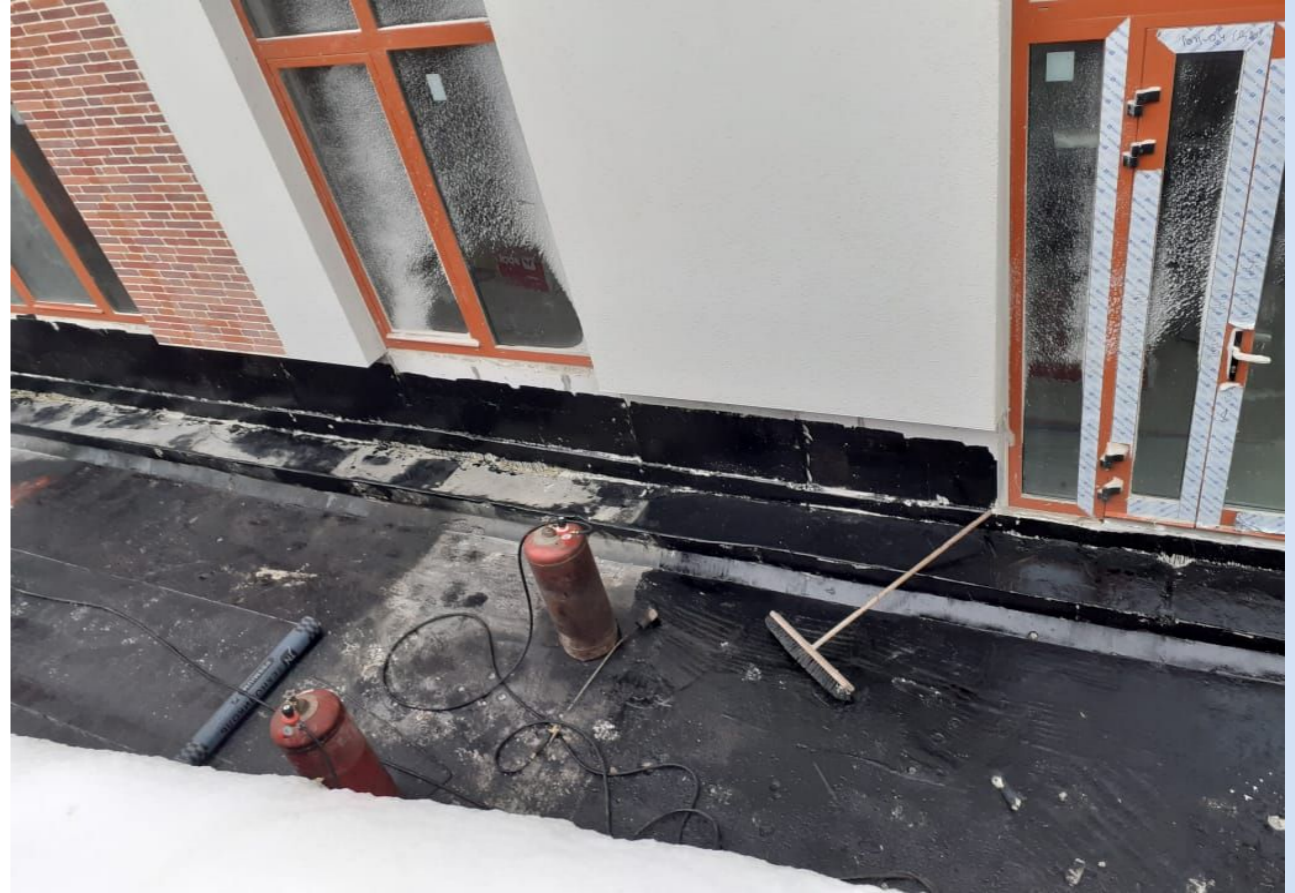
Корпус №6. Не завершены работы по благоустройству территории.