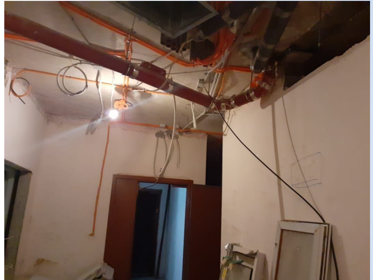
Корпус №6. Не завершены монтажные работы сантехнического и вентиляционного оборудования, слаботочных систем, систем электроснабжения, противопожарных систем.