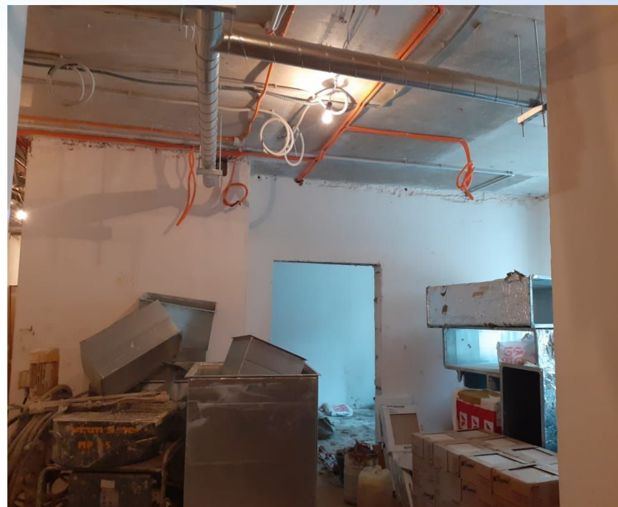
Корпус № 6. Не завершены пусконаладочные работы.