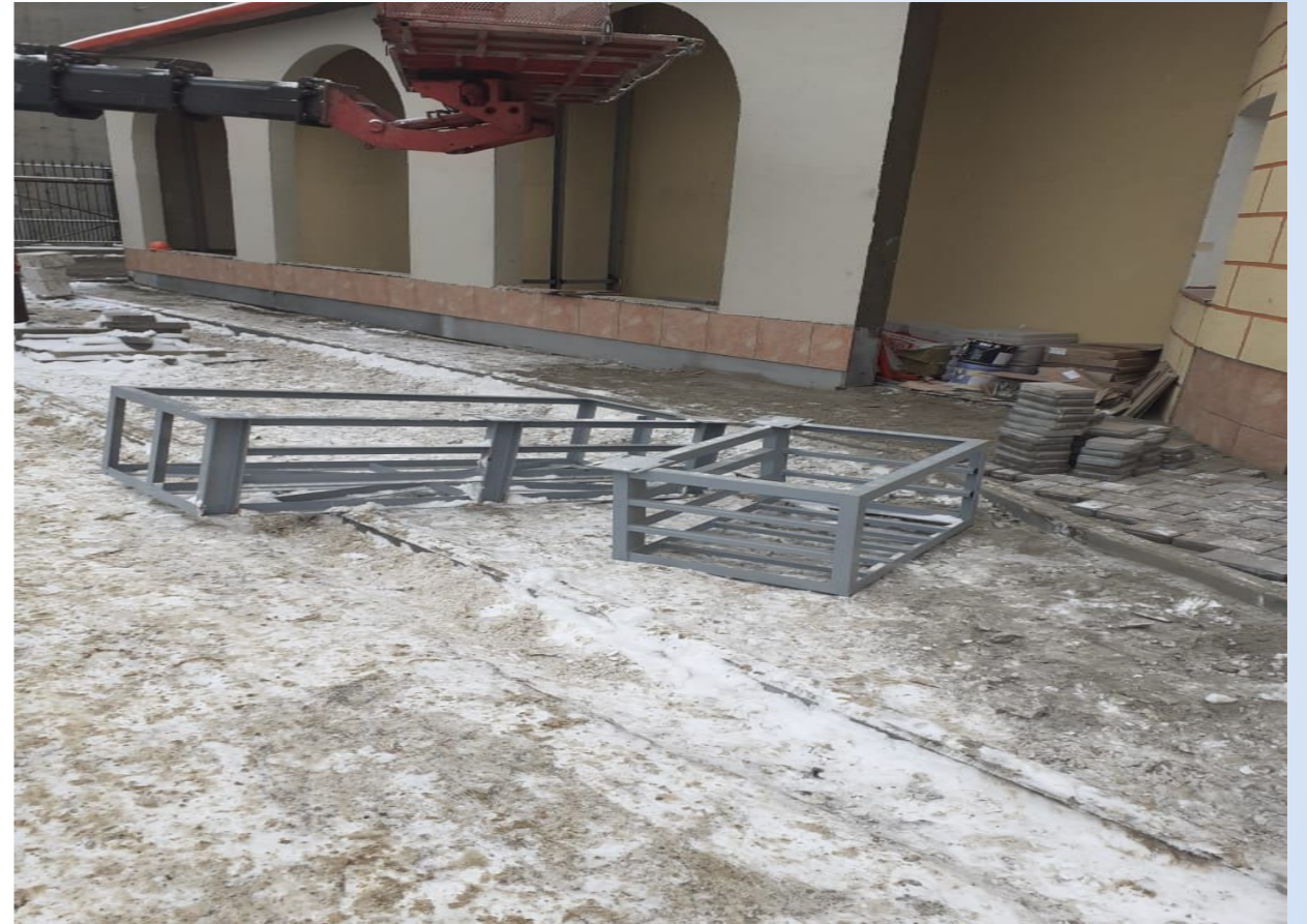
Корпус №5. Не завершены работы по устройству фасада.