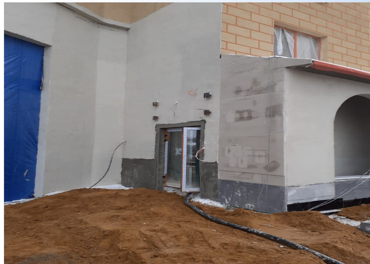
Корпус №5. Не завершены работы по благоустройству территории.