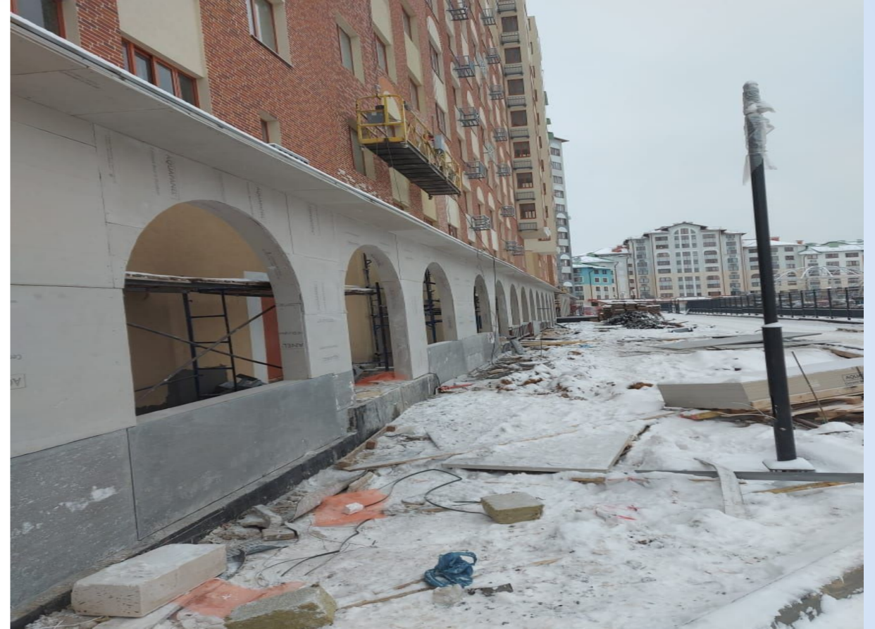
Корпус №3. Не завершены работы по благоустройству территории.