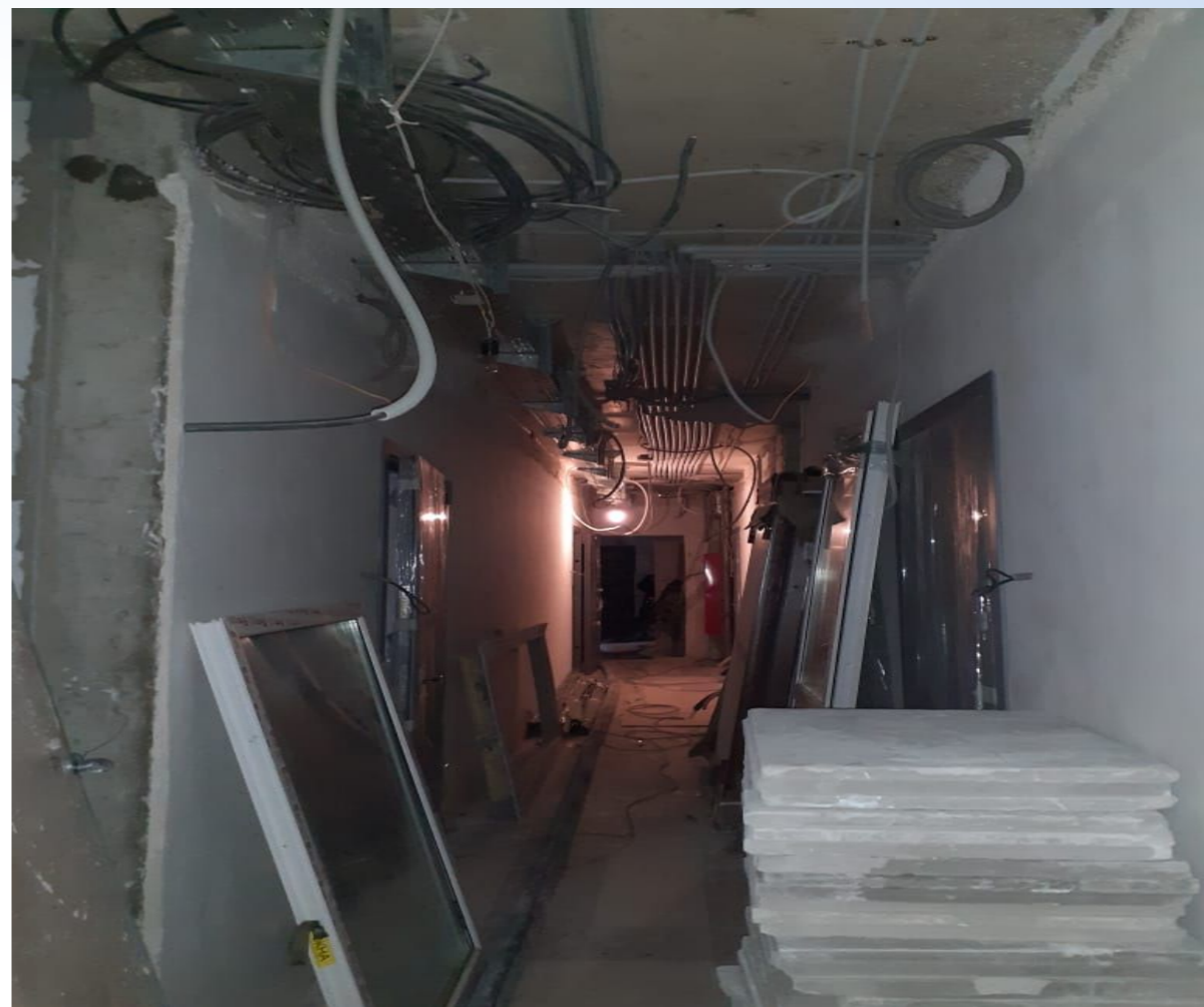
Корпус № 5. Не завершены пусконаладочные работы.