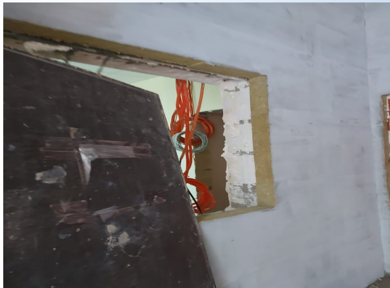
Корпус №3. Не завершены работы по отделке внутренних помещений .