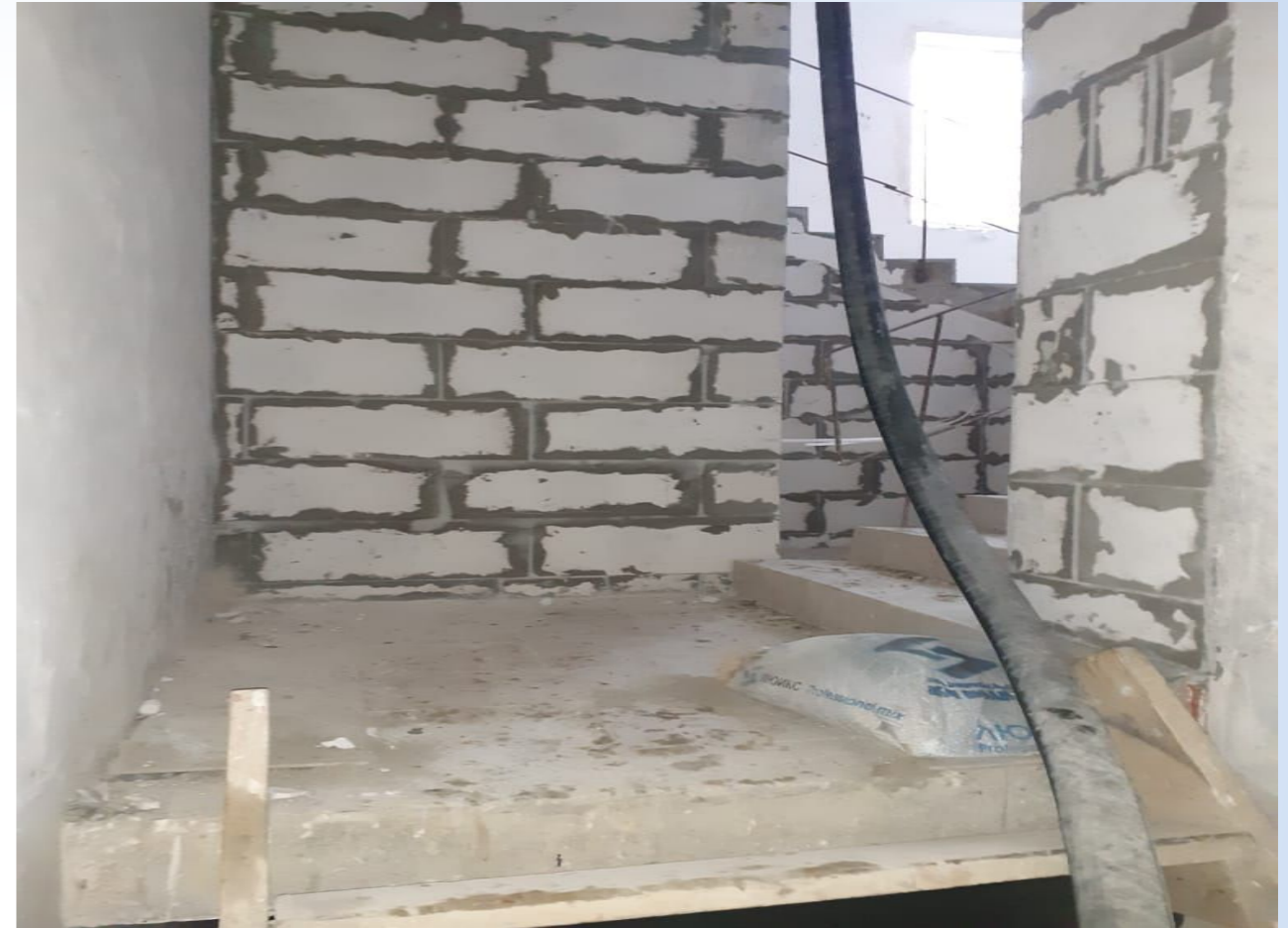
Корпус №5. Не завершены работы по отделке внутренних помещений .