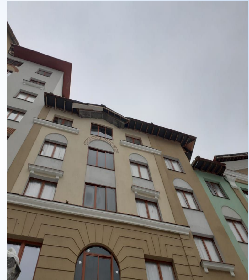
Корпус №6. Не завершены работы по устройству фасада.