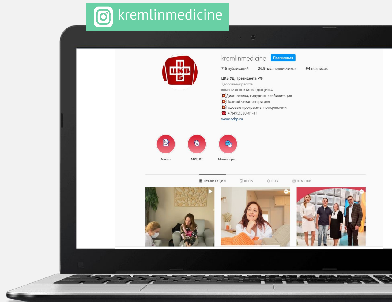
Центральная клиническая больница с поликлиникой Управления делами Президента РФ