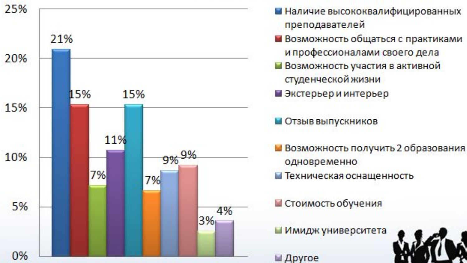
Факторы, влияющие на принятие решение о поступлении