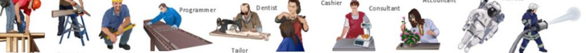
Builder Carpenter Engineer Worker of Conveyor Tailor Hairdresser Shop Assistant Florist Spaceman Fireman