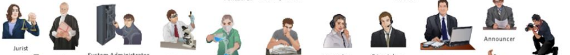
Jurist Judge System Administrator Biologist Chemist Student Dispatcher Dispatcher Director Announcer Photographer