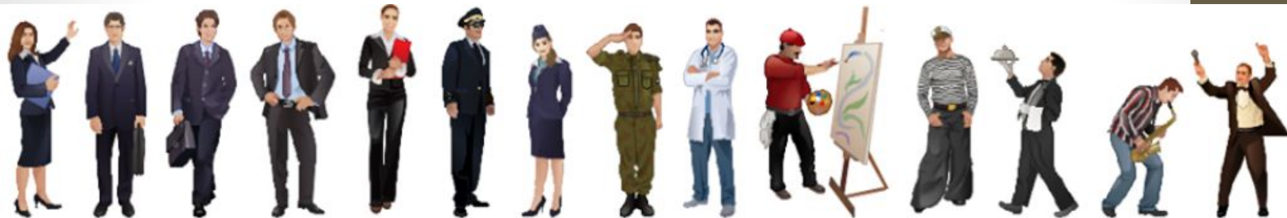
Clerk Clerk Clerk Manager Secretary Pilot Flight Attendant Soldier Doctor Artist Seaman Waiter Musician Presenter