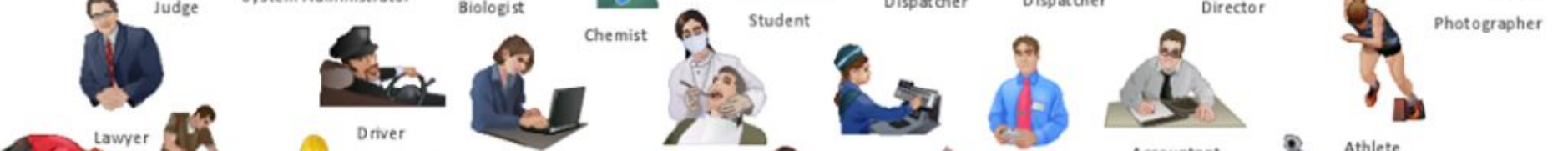
Lawyer Driver Programmer Dentist Cashier Consultant Accountant Athlete