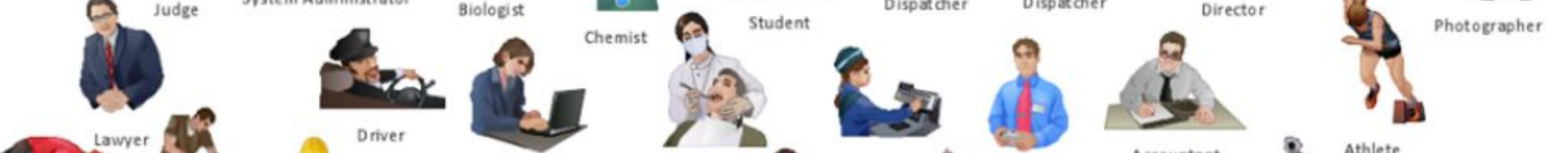
Lawyer Driver Programmer Dentist Cashier Consultant Accountant Athlete