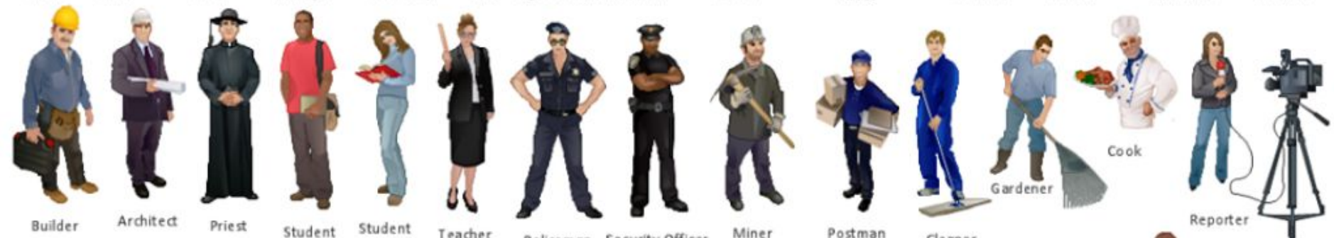
Builder Architect Priest Student Student Teacher Policeman Security Officer Miner Postman Cleaner Gardener Cook Reporter