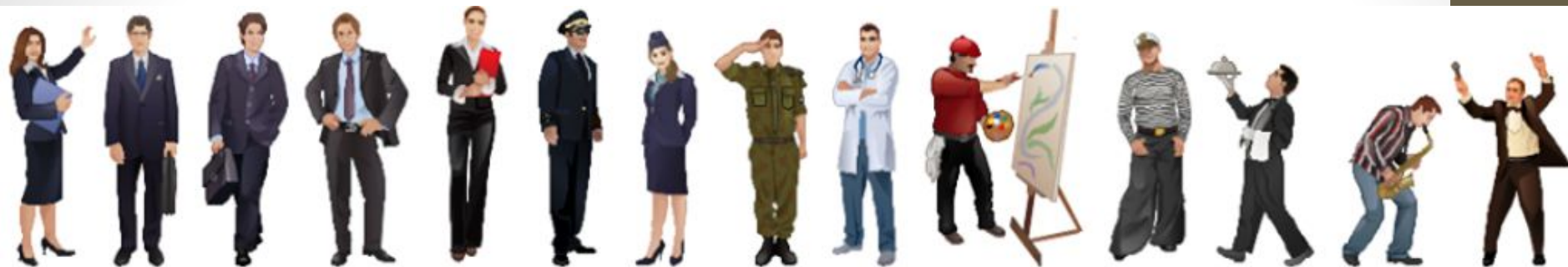
Clerk Clerk Clerk Manager Secretary Pilot Flight Attendant Soldier Doctor Artist Seaman Waiter Musician Presenter