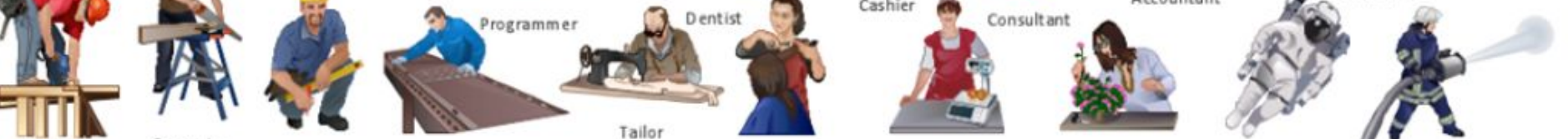
Builder Carpenter Engineer Worker of Conveyor Tailor Hairdresser Shop Assistant Florist Spaceman Fireman