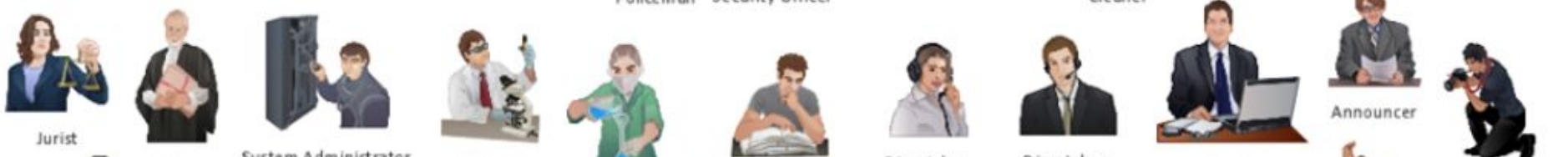
Jurist Judge System Administrator Biologist Chemist Student Dispatcher Dispatcher Director Announcer Photographer