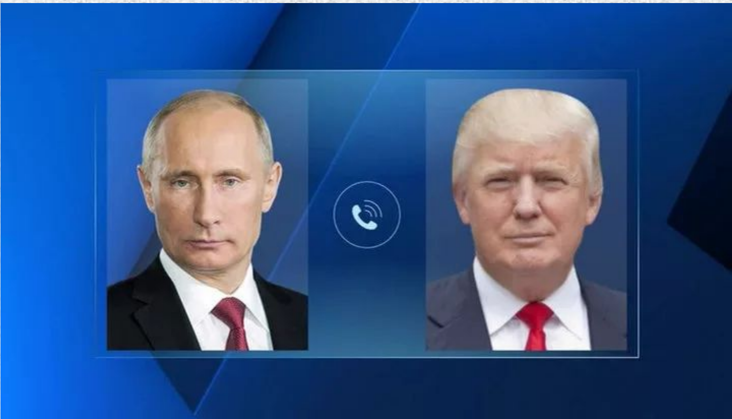
Телефонный разговор с Президентом США Дональдом Трампом