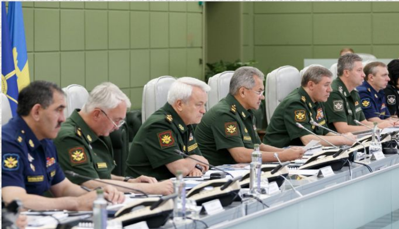
Министр обороны провел селекторное совещание с руководством Вооруженных Сил