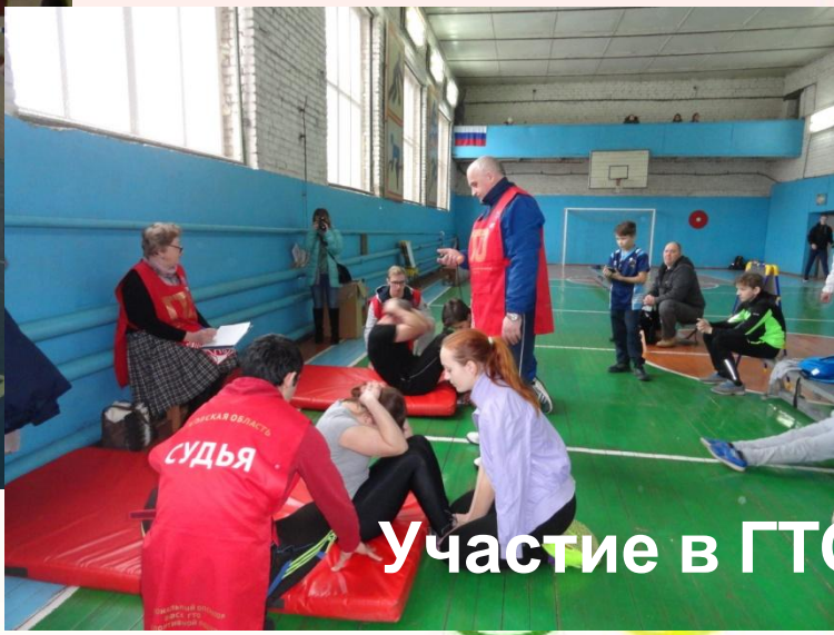
Участие в ГТО