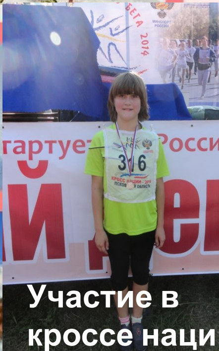
Участие в кроссе наций