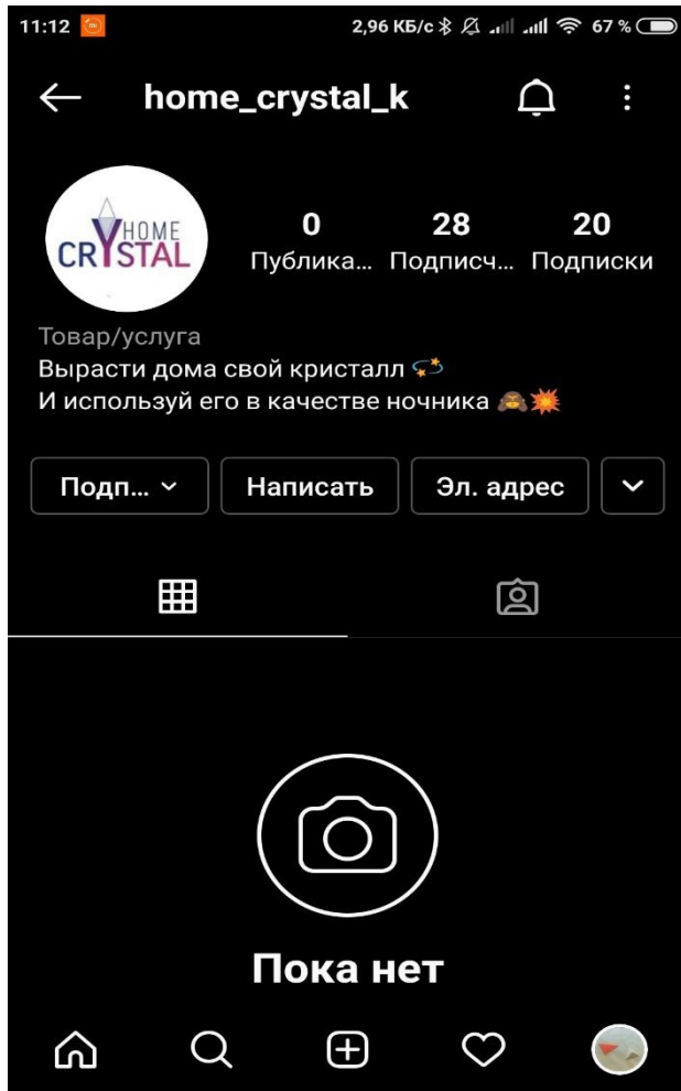
Рис.5 Аккаунт в Instagram

ИНСТИТУТ ХИМИИ И ЭКОЛОГИИ ВЯТСКОГО ГОСУДАРСТВЕННОГО УНИВЕРСИТЕТА