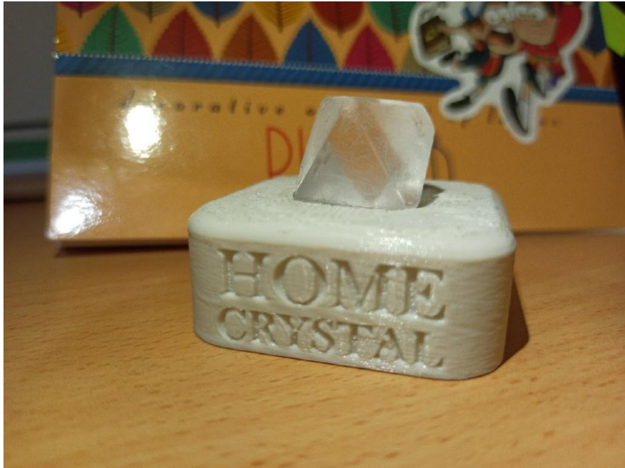
Рис.1 Первый вариант подставки