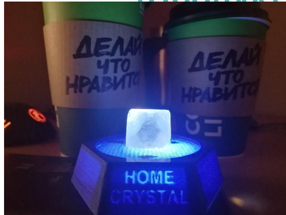
Рис.4 Подставка-ночник 2.0