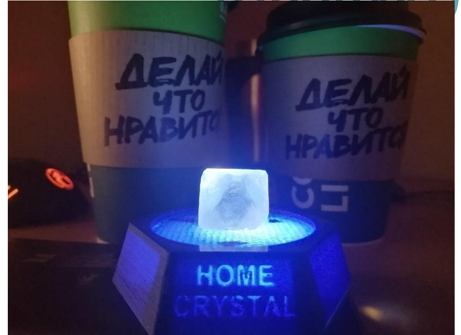
Рис.4 Подставка-ночник 2.0