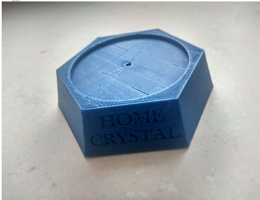
Рис.3 Второй вариант подставки