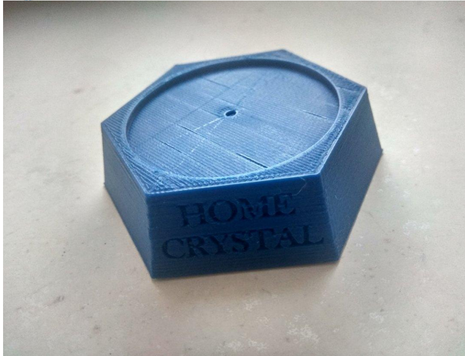
Рис.3 Второй вариант подставки