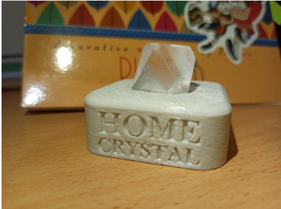
Рис.1 Первый вариант подставки