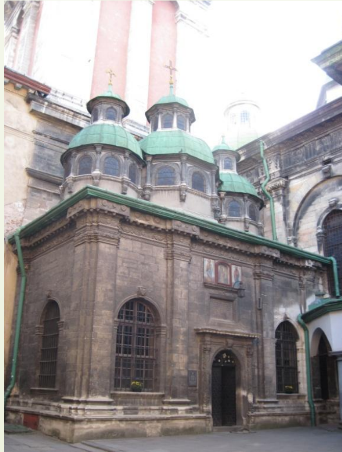
каплиця Трьох Святителів