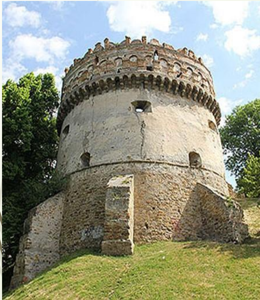
Острозький замок. Кругла (Нова) вежа. Кінець XVI ст.

Постійні загрози нападів ворогів обумовлювали необхідність спорудження приватних і державних фортець або замків