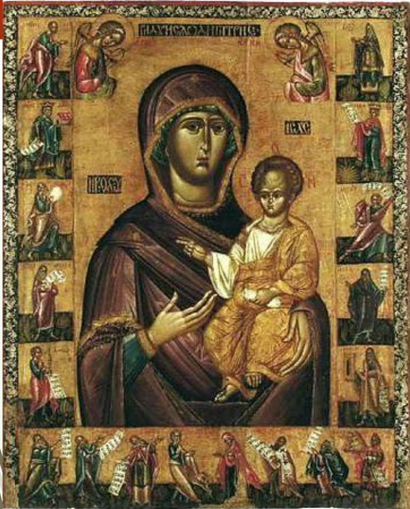
Ікона Богородиці з пророками з церкви у Підгородцях. Кінець XV — початок XVI ст.