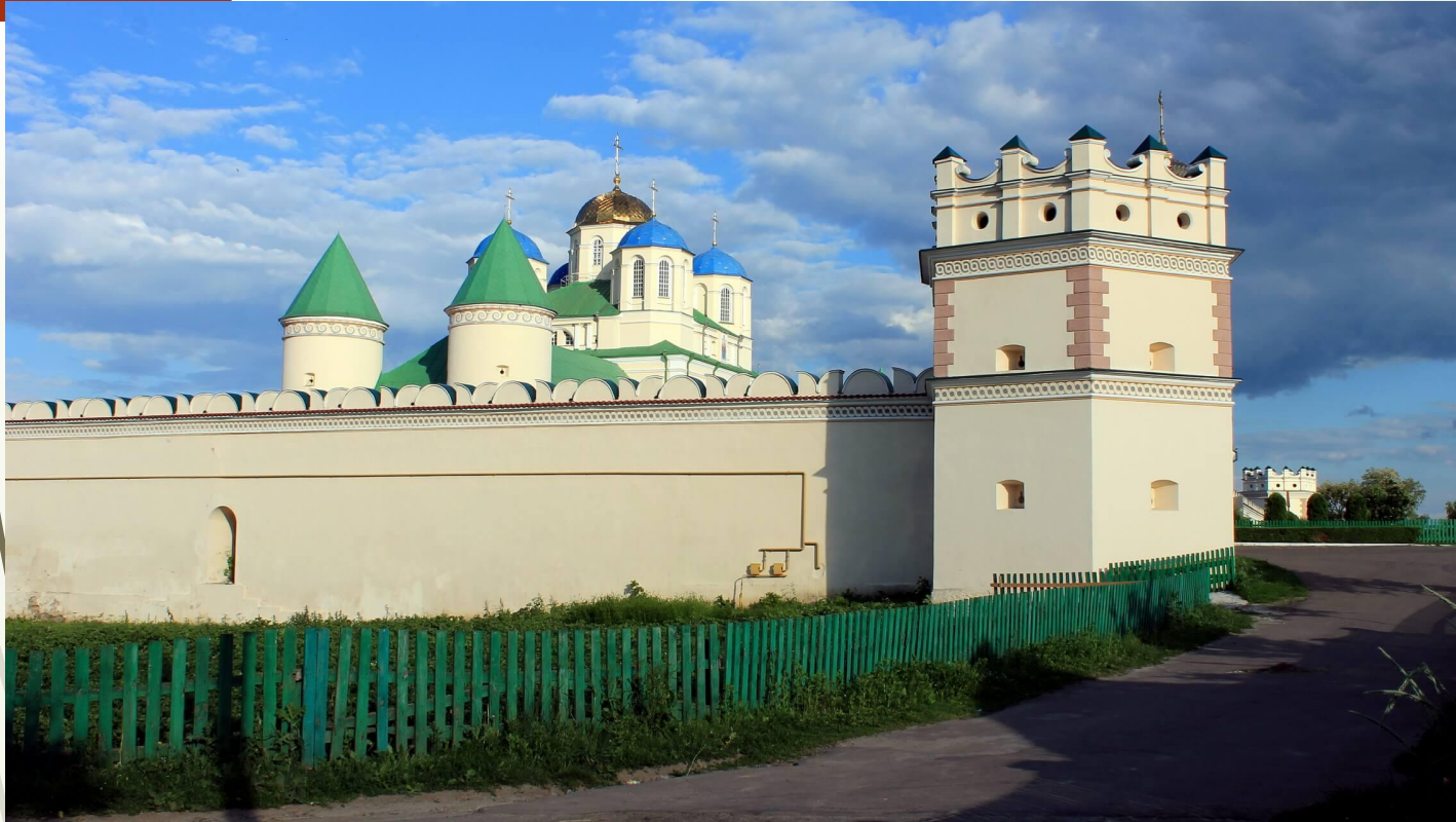
Троїцький чоловічий монастир в с.Межиріч біля м. Острог на Волині

Деякі монастирі були оточені мурами з вежами й виконували роль фортець