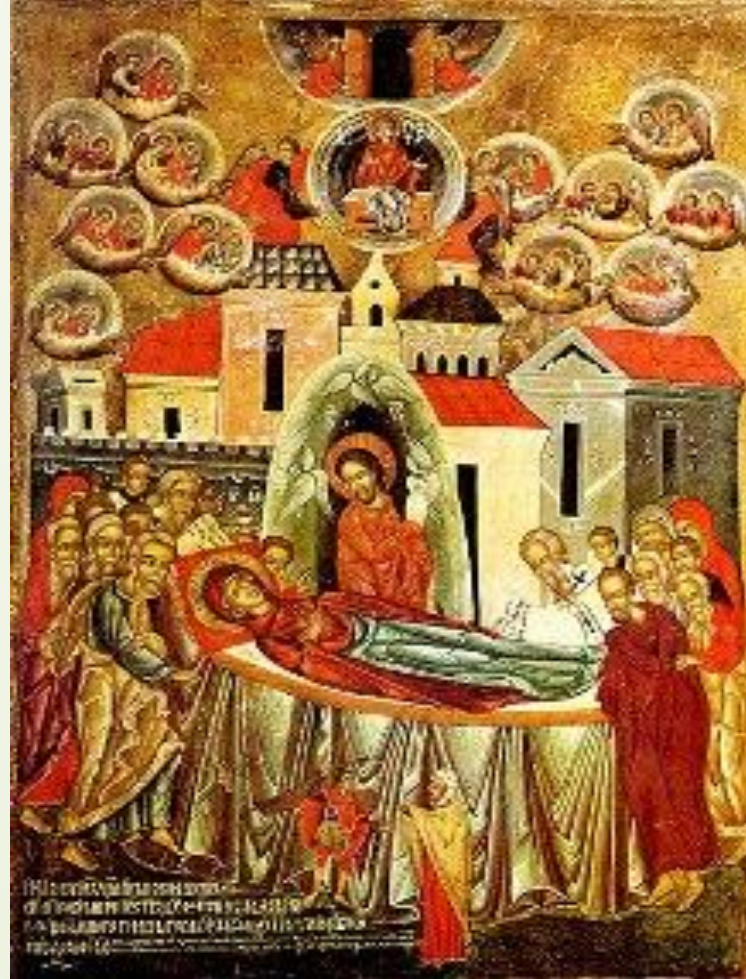
Ікона «Успіння Богородиці». 1547р. О. Горошковим