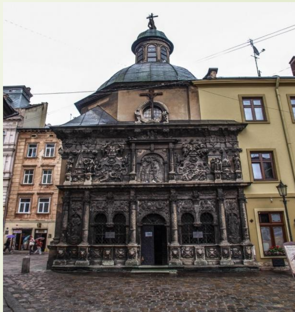
Ансамбль Кафедрального костелу у Львові каплиця Боїмів. 1609-1617р.