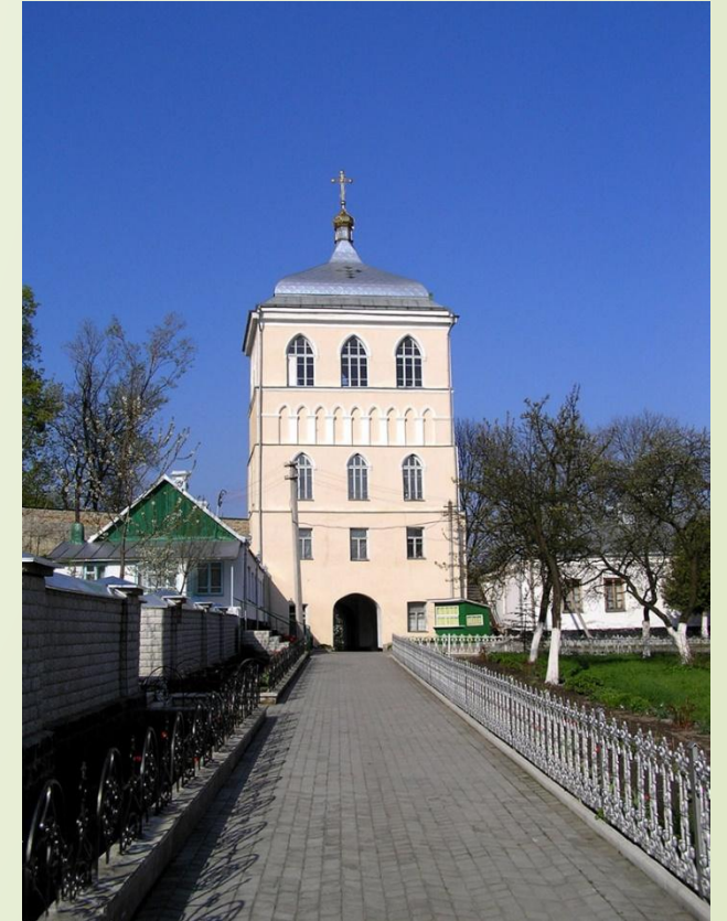
В 1574—1575 рр. управителем Дерманського монастиря був першодрукар Іван Федоров