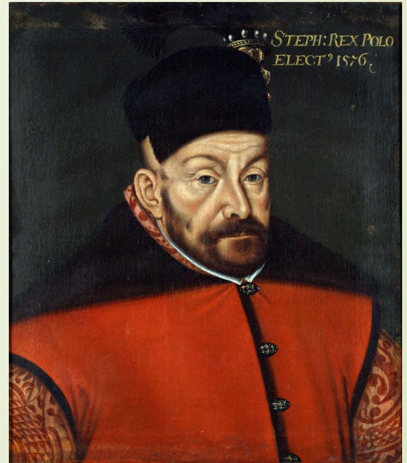
Портрет Стефана Баторія. Худ. Войцех Стефанович