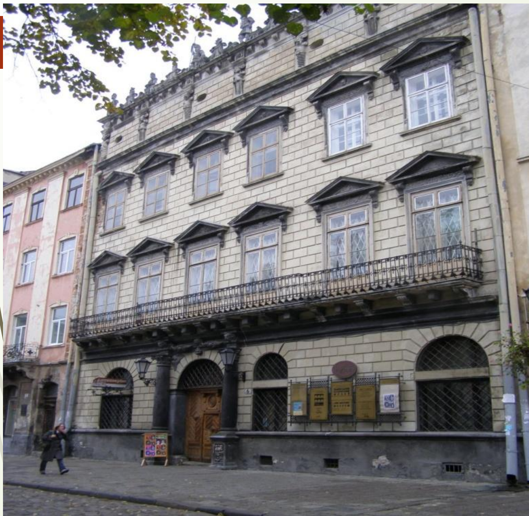
Ансамбль площі Ринок у Львові будинок Корнякта. 1580 р.