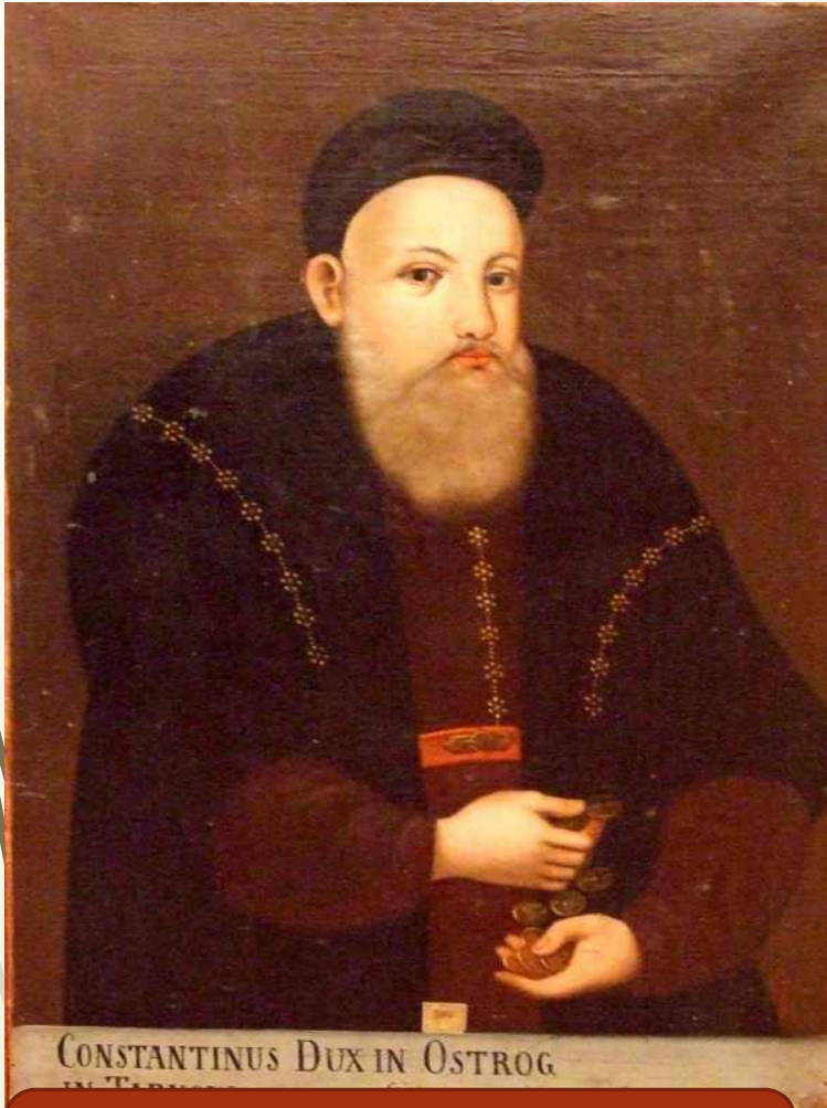
Портрет К.-В. Острозького. Н.Х.

У другій половині XVI ст. в українському малярстві відбуваються процеси відокремлення портрета від іконопису й перетворення його на самостійний жанр мистецтва