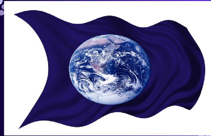
Символ Дня Земли