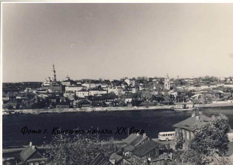
Фото г. Кинешма начала XX века.

один из старейших дворянских родов, начинается с XIV века, имеет одни корни с Шереметьевыми, Колычевыми, Боборыкиными и другими. Примерно с середины XVIII века Яковлевы жили в Кинешемском уезде, имели здесь свои земли, усадьбы, дома, храм. С 1894 года в семье начали уделять внимание своей истории.