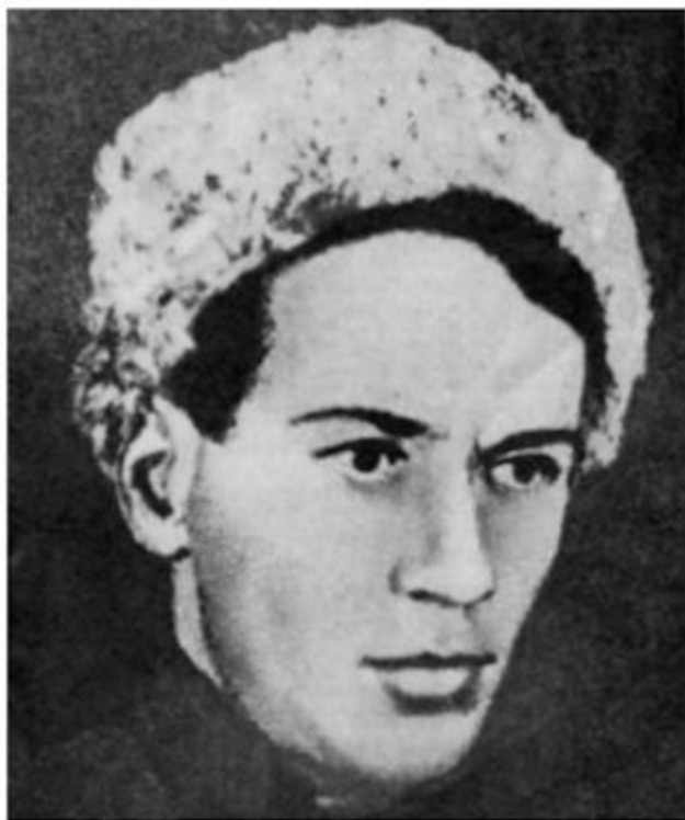
М. Шолохову 20 лет