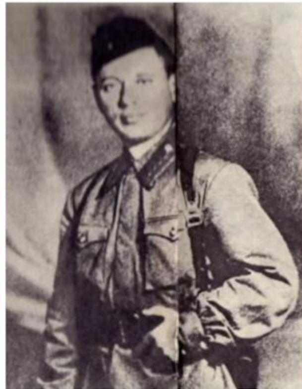
Шолохов военный корреспондент «Правды». 1941