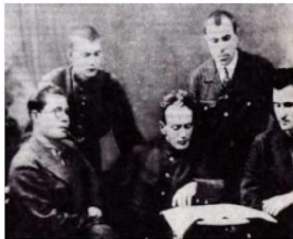
15 ноября 1923