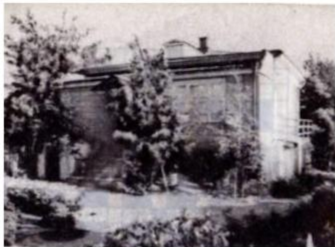
Дом в Вешенской, где Шолохов работал над «Тихим Доном»