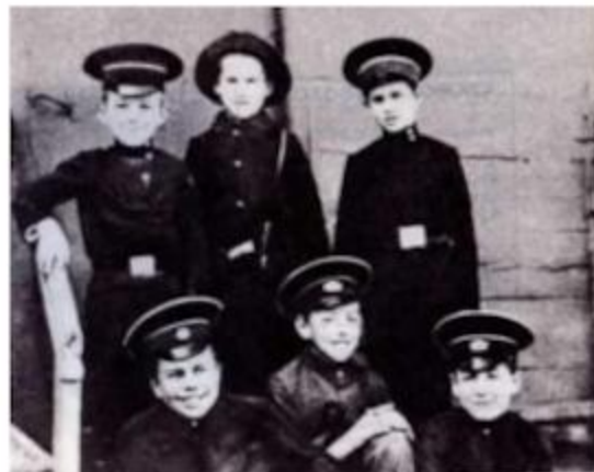
Годы учёбы в гимназии