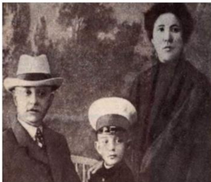
Шолохов с родителями (1912)