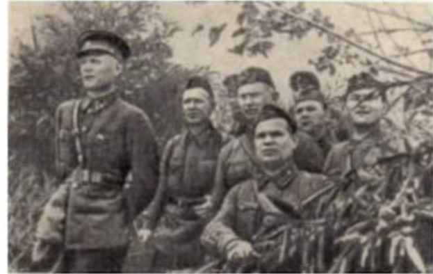
Западный фронт, 1941