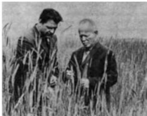
Шолохов и первый секретарь Вёшенского райкома КПСС Н.А. Булавин