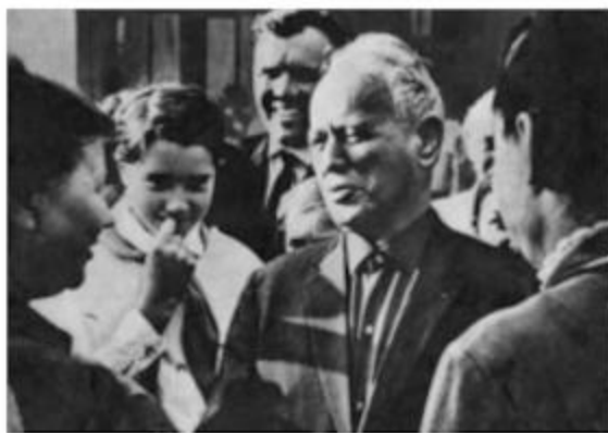
Шолохов среди земляков