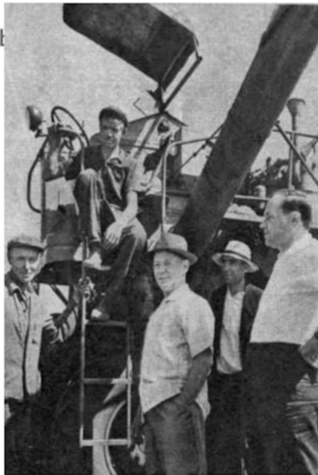
Писатель – частый гость хлеборобов