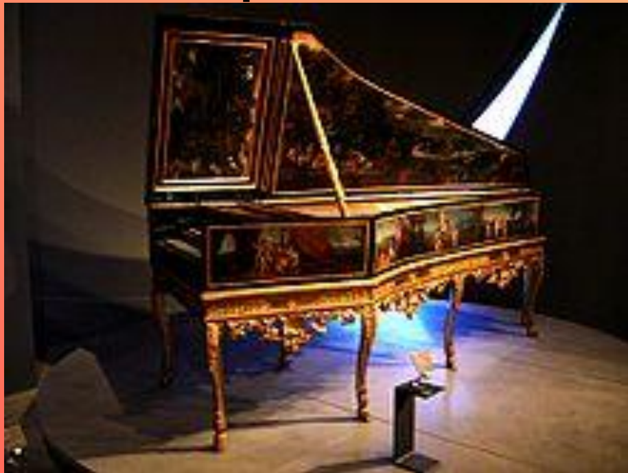
Французский клавесин 17-го века

Предшественниками фортепиано являлись КЛАВЕСИН и изобретённый позднее КЛАВИКОРД .