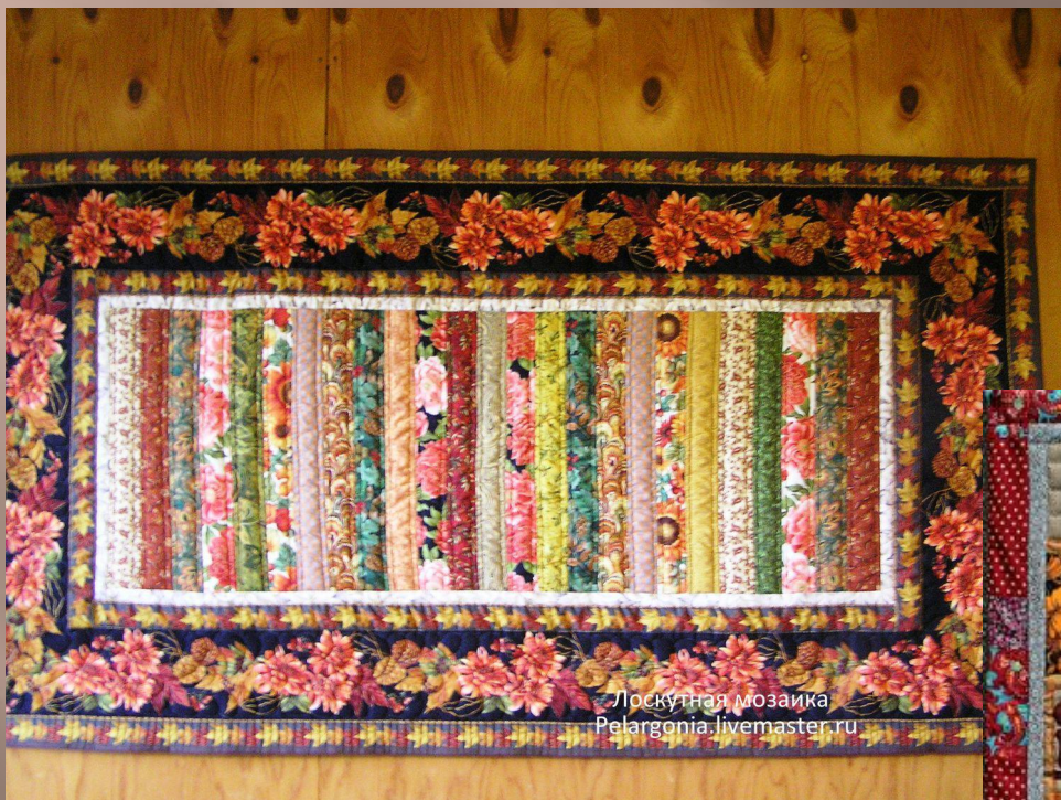
Лоскутная мозаика Pelargonija.livemaster.ru